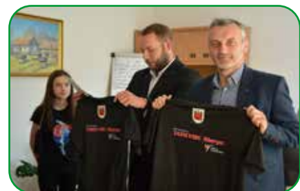
Jesteśmy dumni z Waszych osiągnięć i za godne reprezentowanie Naszego Miasta. Dziękujemy za odwiedziny i życzymy dalszych sukcesów.