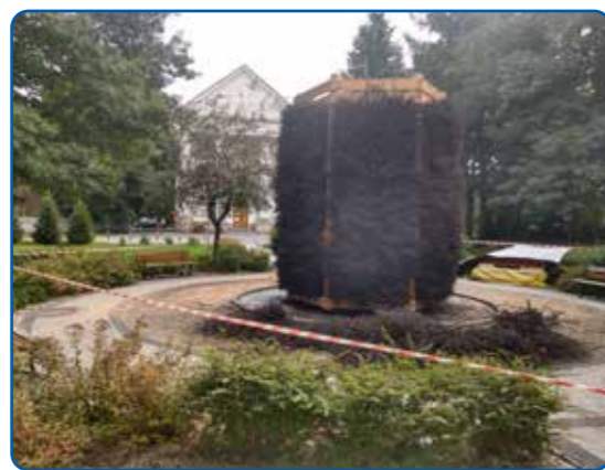
Budowa tężni solankowej w parku im. Janusza Korczaka