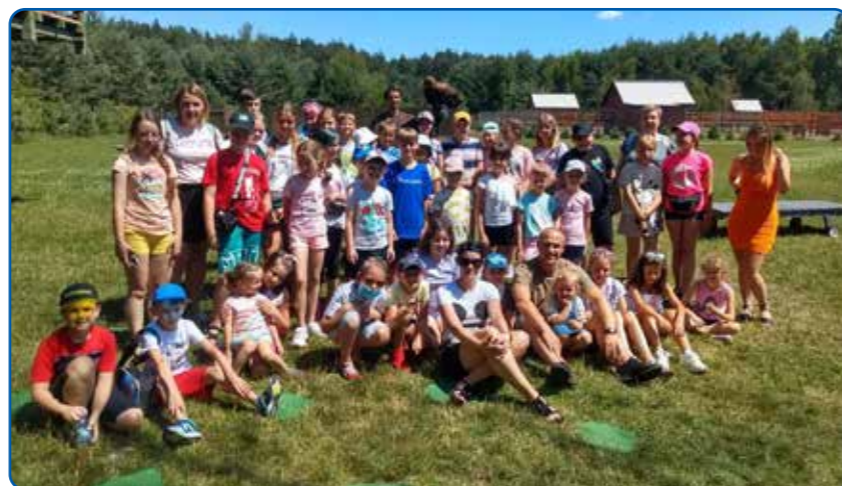
Osiedlowa wycieczka w ramach akcji Lato w Mieście