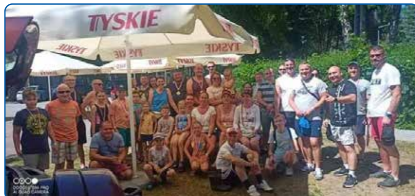
Rowerowy Rajd do Bledzewa

Dzięki współpracy z Zarządem Osiedla nr 4 mogłem brać czynny udział w organizacji imprez skierowanych dla naszych mieszkańców. Odbyła się impreza plenerowa z okazji Dnia Dziecka, Rajd Rowerowy do Bledzewa oraz wycieczka dla dzieci do Parku Rozrywki Frajdalandia.