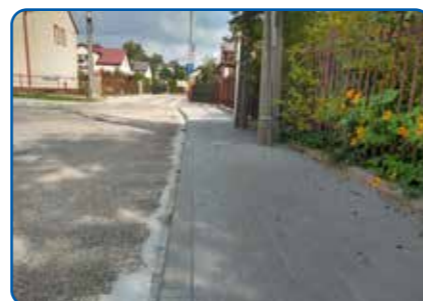
Nowy chodnik przy ulicy Mikołaja Kopernika