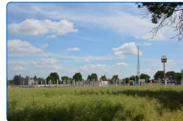
Budowa Stacji Sierpc - Retail Park