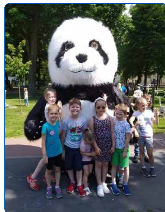
Osiedlowy Dzień Dziecka