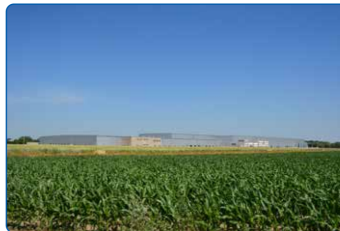
Budowa centrum logistycznego DINO Polska S.A.

W Sierpcu realizowane są nie tylko miejskie inwestycje, ale także inwestycje inwestorów zewnętrznych. Przykładem są: