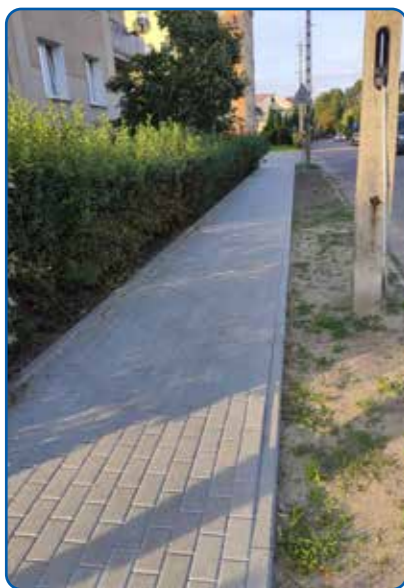
Nowy chodnik przy ulicy Kwiatowej

Letnie miesiące to czas korzystnych zmian w infrastrukturze naszego miasta. Wśród inwestycji i remontów realizowanych w Sierpcu nie mogło zabraknąć prac na naszym osiedlu. Dokonano utwardzenia destruktem ulicy Fredry, wyremontowano chodniki przy ulicach Kwiatowej i Mikołaja Kopernika. W parku im. Janusza Korczaka powstaje tężnia solankowa w kształcie walca. Projekt jest realizowany w ramach współpracy z Lokalną Grupą Działania – Sierpeckie Partnerstwo.