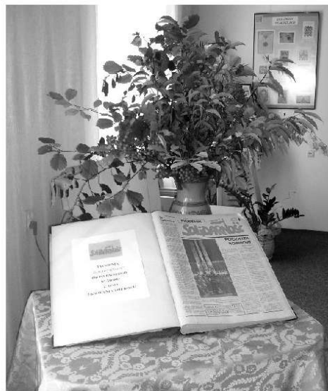
Oprawny tom „Tygodnika Solidarność” pierwszego numeru z dnia 3 kwietnia 1981 roku.