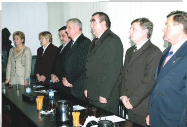
Sierpeccy radni składają ślubowanie