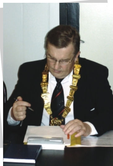
Burmistrz w czasie obrad sesji