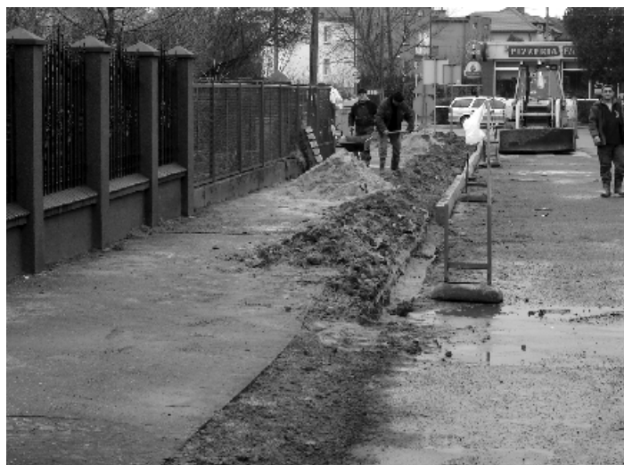
Trwają prace remontowe w ul. Sienkiewicza.