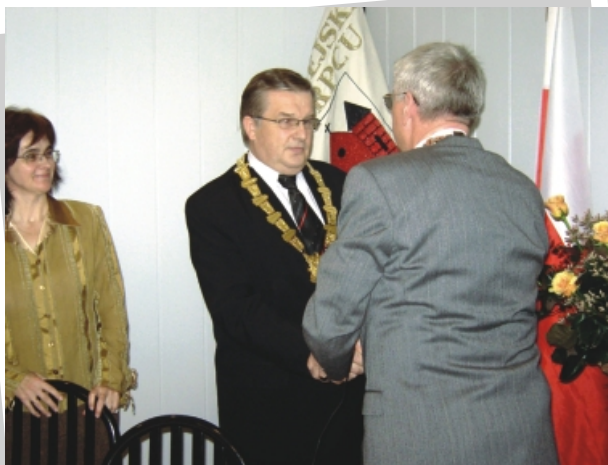
Burmistrz przyjmuje gratulacje od przewodniczącego rady