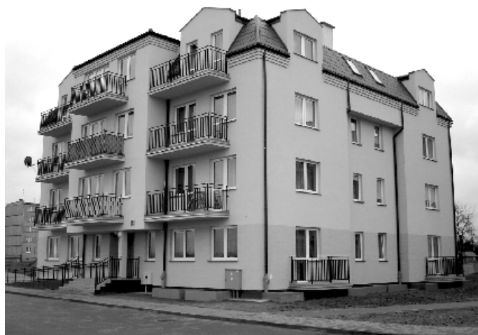
Nowy budynek TBS przy ul. Paderewskiego 4.