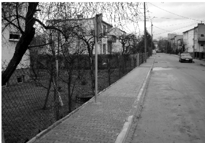
Nowy chodnik w ul. Reja.