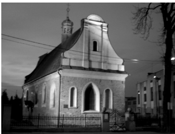
Podświetlony kościół Św. Ducha.