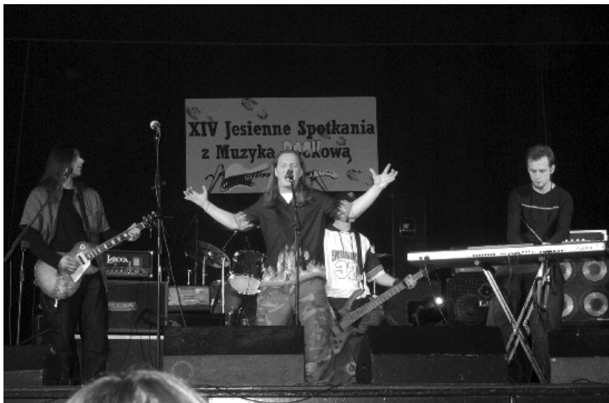
Zespół „Carrion” z Radomia – laureat.

W konkursie brali udział: „Filli Noctis” z Kiernozi, „Euforia” z Płocka, „Open to the Public” z Sierpca, „Stan Wojenny” z Gąbina, „Carrion” z Radomia, „Line Out” z Torunia, „The Inside” z Sierpca i „AQQ” z Płocka.