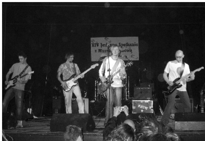
Gwiazda wieczoru – Zespół „Plateau”.

Rockową fetę zakończył koncert wołomińskiego zespołu „Plateau”, którego brytyjskie brzmienie zostało bardzo ciepło odebrane przez naszą publiczność.