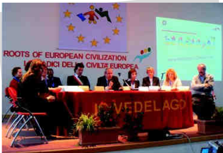
Konferencja w szkole w Vedelago.