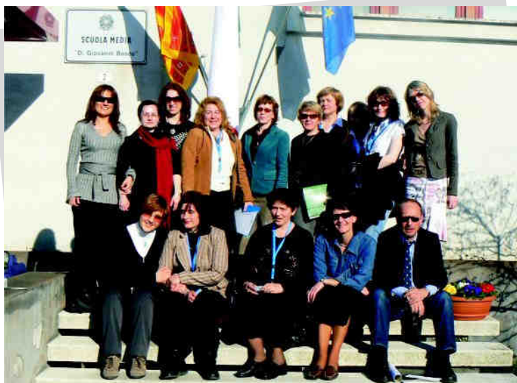
Spotkanie przed budynkiem szkoły w Vedelago.