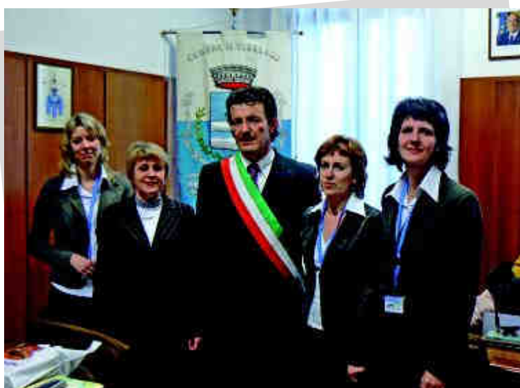
Spotkanie z burmistrzem w Urzędzie Miasta.