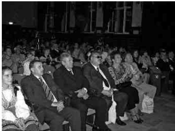
Delegacja ze Słowacji uczestniczyła w koncercie inauguracyjnym XII Międzynarodowego Festiwalu Folklorystycznego „Kasztelania 2007”.

Przy okazji warto przypomnieć, że przed kilku laty burmistrzowie Sierpca i Złatych Morawec podpisali list intencyjny w sprawie nawiązania dwustronnej współpracy. W trakcie sobotniego spotkania zrodziło się na ten temat kilka pomysłów. Poinformujemy o nich, gdy przybiorą bardziej realne kształty.