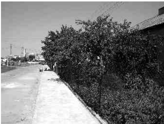
Chodnik przy ul. Sempotowskiej - wykonawca ZGM w Sierpcu.