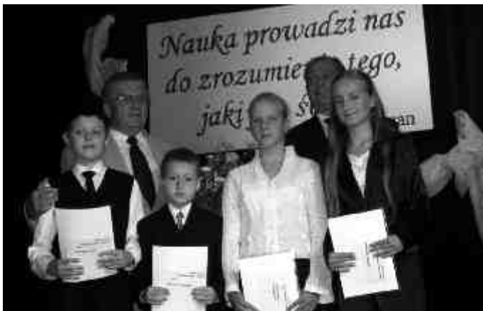
Burmistrzowie i nagrodzeni uczniowie Szkoły Podstawowej Nr 3.