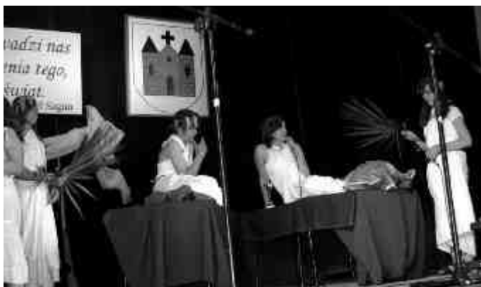
Występ uczniów Gimnazjum im. bpa. L. Wetmańskiego.