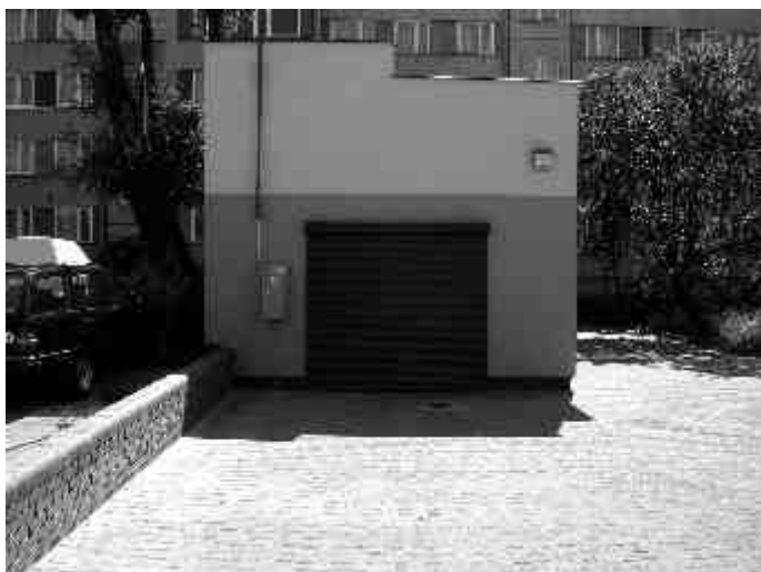
Magazyn żywności przy ul. Narutowicza - teren wokół budynku po przeprowadzonym remoncie.