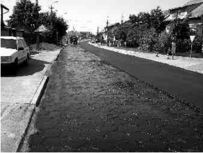
Remont ul. Zawiszy Czarnego.