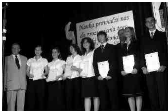
Burmistrzowie i nagrodzeni uczniowie Gimnazjum Miejskiego.

dziedzinie wiedzy lub nauki, potwierdzone w zewnętrznych konkursach lub olimpiadach.