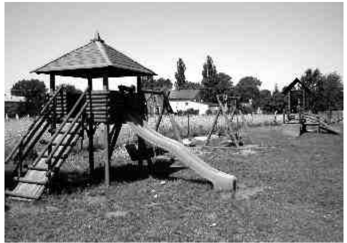
Nowy plac zabaw przy ul. Piastowskiej (za torami) na osiedlu nr 6.