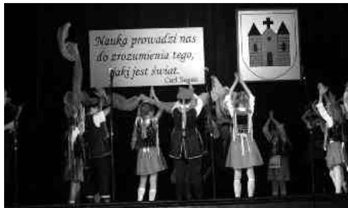
Występ uczniów ze Szkoły Podstawowej Nr 2.