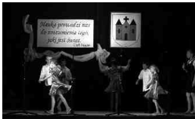
Występ uczniów z I Prywatnej Szkoły Podstawowej.