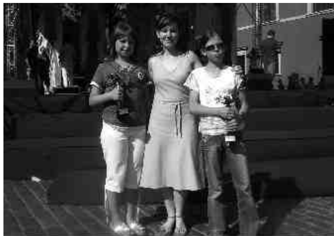
Plac Zamkowy. Warszawa - 17.06.2007 r.

Każdy sukces odniesiony przez młodych artystów motywuje ich do dalszego pogłębiania zainteresowań, zdobywania wiedzy na temat technik plastycznych, a przede wszystkim uczy wrażliwości na piękno otaczającego świata.