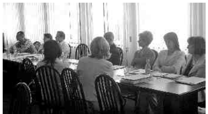
Podczas szkolenia prowadzonego przez przedstawicieli EFS 29.08.2007 r.