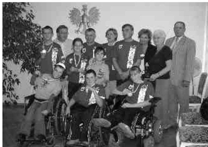
W dniu 25.09.2007 r. uczestnicy Biegu Solnego spotkali się z burmistrzem.

Burmistrz podziękował zawodnikom za godne reprezentowanie miasta, podkreślił promocyjną rangę ich wyczynu – mimo że w zawodach debiutowali – zajęli czołowe miejsca. Była, oczywiście, dekoracja okolicznościowymi medalami. Ale najważniejsza była, trudna do opisanego, radość i wzruszenie głównych bohaterów tej imprezy, która udzieliła się ich rodzicom. Dali temu wyraz w swoich wypowiedziach.