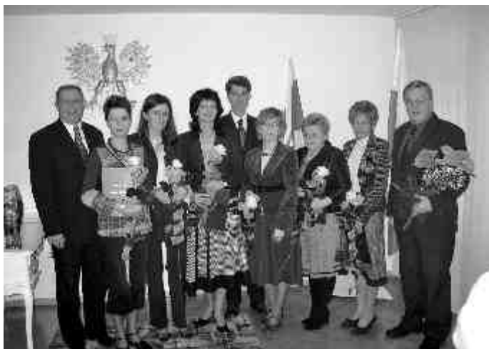
Nagrodzeni nauczyciele z przedstawicielami samorządu miejskiego.

(2006 r.) oraz wyróżnienia w konkursach plastycznych: Argentyna w oczach małego Polaka (2004 r.), Przyroda – Twój przyjaciel (2004 r.), Płock w malarstwie (2006 r.).