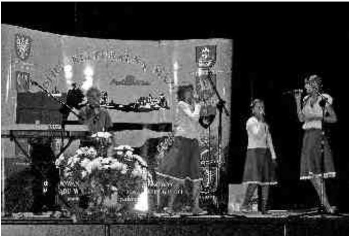
Zespół „Demain” ze Szkoły Podstawowej w Szczutowie.

Sprawozdanie z działalności Stowarzyszenia. (Część pierwsza - od powstania organizacji do jej rejestracji - w wersji oryginalnej).