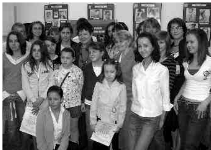
Laureaci VII edycji konkursu literackiego wraz z organizatorami i jurorkami.