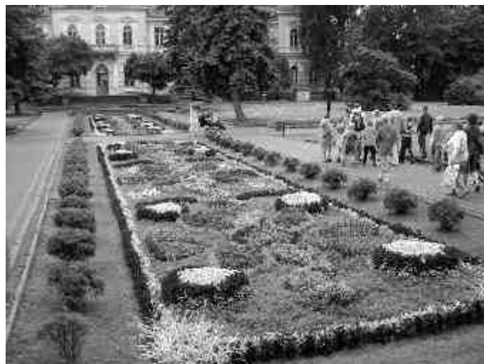
28.07.2007 r. - młodzie sierpczanie w Ciechocinku.

i kolorystyki, ćwiczyć różnorodne techniki, uczestniczyć w zajęciach w pracowni i w plenerze.