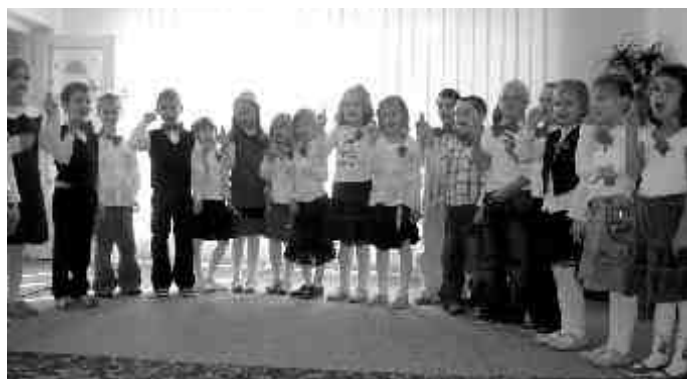
Powitanie gości, dziecięce życzenia.

O swoich paniach pamiętały również dzieci z Miejskiego Przedszkola Nr 3 w Sierpcu. Z tej okazji odbyła się w dniu 15.10.2007 r. o godz. 10.00 uroczysta akademia, podczas której dzieci recytowały wiersze, śpiewały piosenki, prezentowały układy taneczne wyrażając w ten sposób swoją wdzięczność za trud włożony w swoje wychowanie.