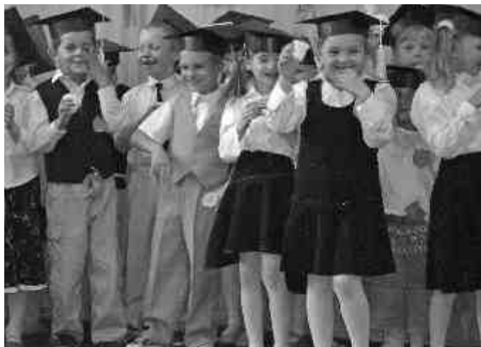
„Kwaśne zadanie” - wypicie soku z cytryny.