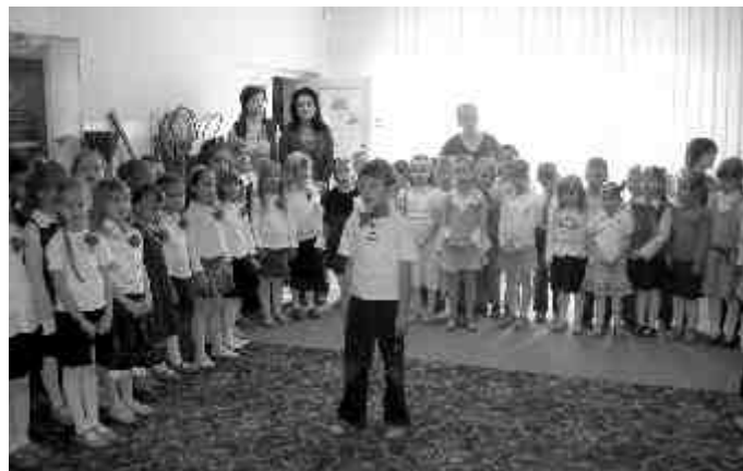
Uroczyste ślubowanie przedszkolaków.