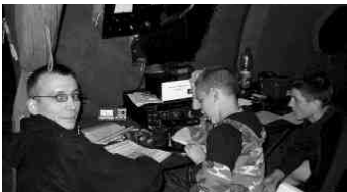
Ćwiczenia z technik krótkofalarskich - Choczewo.

uczestniczyły w zabawach integracyjnych, uczyły się piosenek, brały udział w konkursach, odbyły rajd pieszy „Czerwonym Szlakiem im. Bolesława Krzywoustego”, odwiedziły katedrę i Ogród Zoologiczny w Płocku oraz obejrzały film w żuromińskim kinie. Codziennie każdy uczestnik spożywał posiłek. Ponadto 17 młodych sierpczan wzięło udział w trzytygodniowym obozie szkoleniowym w sportach obronnych. W Stanicy Dobrej Przygody w Choczewie (ok. 25 km od Łeby) uczestnicy poznawali tajniki krótkofalarstwa, korzystali z zajęć kulturalno – oświatowych, odwiedzili Gdańsk i Westerplatte oraz zdawali egzamin państwowy na świadectwo radiooperatora.