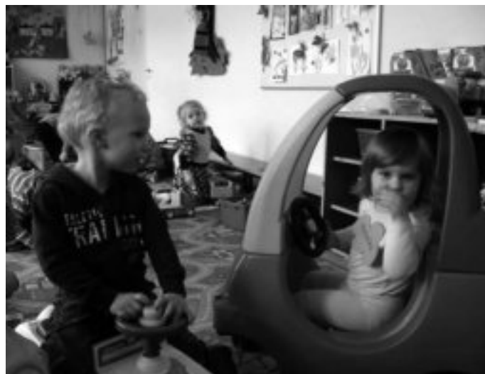
Rada Pedagogiczna Miejskiego Przedszkola nr 2 w Sierpcu

Dni otwarte – z radością powitaliśmy kandydatów na nowych przedszkolaków. Dzieci wraz z rodzicami mogły zwiedzać nasze przedszkole i uczestniczyć w ciekawych zabawach i zajęciach.