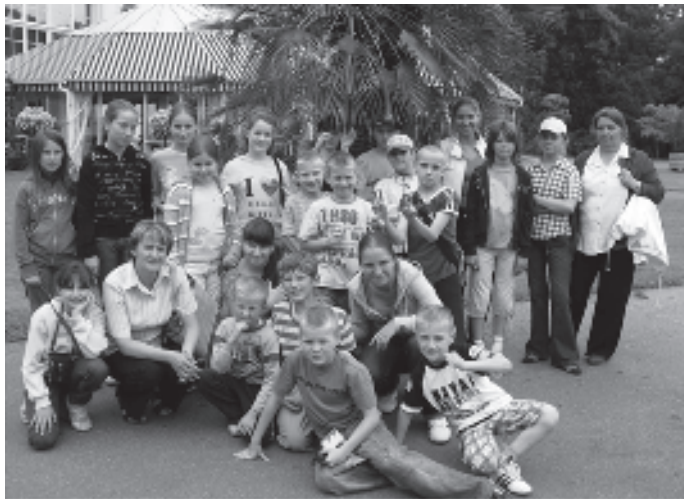
Podopieczni świetlicy Środowiskowego Ogniska Wychowawczego w warszawskich Łazienkach.

w zajęciach rekreacyjno-sportowych, odbywały spacery oraz realizowały programy: Radość bez alkoholu , Tajemnica zaginionej skarbonki , Wakacje bez ryzyka , Moja rodzina , Drzewo genealogiczne , Nie wpuszczam obcych do domu , Co można a czego nie można jeść , Niebezpieczne zabawy . W czasie pobytu w świetlicy grupa 20 wychowanków korzystała z całodziennego wyżywienia.