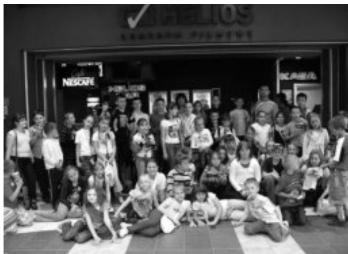
Uczniowie Dwójki na chwilę przed seansem w kinie Helios.

Analogicznie do lat ubiegłych również podczas tegorocznych ferii letnich, realizowana była z powodzeniem akcja Wakacje w mieście . Z myślą o uczniach, którzy w trakcie ponad dwumiesięcznej przerwy w nauce nie mogli wypoczywać poza Sierpcem, specjalną ofertę przygotowały szkoły podstawowe, gimnazjum, Dom Kultury, Miejski Ośrodek Pomocy Społecznej, Zarządy Osiedli Nr 6 oraz 1, 2, 3, 4 i 5 we współpracy z Miejskim Ośrodkiem Sportu i Rekreacji. Poszczególne jednostki, z wyprzedzeniem, informowały o swoich propozycjach na stronach www oraz w formie plakatów rozmieszczonych między innymi na miejskich słupach ogłoszeniowych.