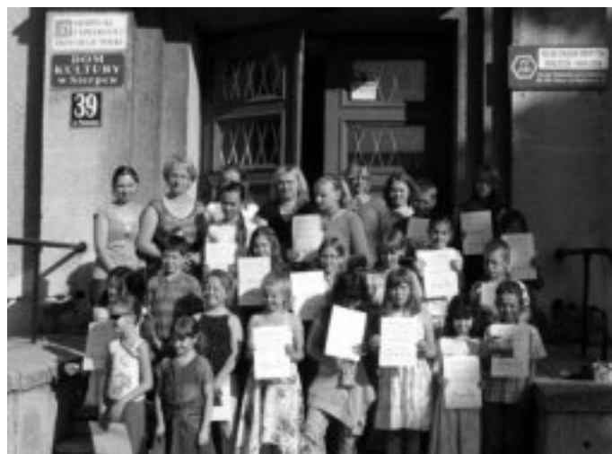
Final IV Pleneru Plastycznego Mała Sztaluga.

Z kolei Szkoła Podstawowa Nr 3 im. ks. Jana Twardowskiego wspólnie z UKS Jutrzenka , zgodnie z wieloletnimi tradycjami, zapewniła uzdolnionym sportowo dziewczętom udział w obozie sportowo - wypoczynkowym. W trwającym 11 dni zgrupowaniu odbywającym się w Wąbrzeźnie wzięło udział 13 uczennic z klas IV-VI.