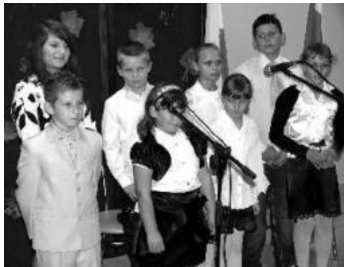
Wystąpiły również dzieci ze Środowiskowego Ogniska Wychowawczego.

sierpczanie zapewne już pamiętają dramatyczne protesty, kiedy most na Sierpienicy, ze względu na stan techniczny, został zamknięty dla ciężkich pojazdów. Na szczęście, kilkuletnie starania zakończyły się pomyślnie. Zmodernizowany, nakładem 900 tys. złotych, most na pewno długo będzie mieszkańcom służył. Bo to ważna przeprawa drogowa do czasu wybudowania obwodnicy.