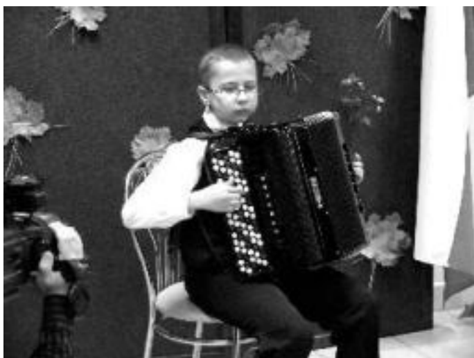
Uroczystość uświetnił występ akordeonistów z Państwowej Szkoły Muzycznej w Sierpcu.

Modernizację i rozbudowę pomieszczeń po żłobku rozpoczęliśmy w 2006 roku. Mieliśmy nadzieję dość szybko się z tym zadaniem uporać ze względu, jak nam się wydawało, realną szansę pozyskania środków z Funduszu Norweskiego. Niestety, nie udało się. Postanowiliśmy tę inwestycję zrealizować za własne, wygosparowane pieniądze. Uważaliśmy, że ten obiekt jest Miejskiemu Ośrodkowi pomocy Społecznej niezbędny. Oczywiście, nie dla wygody pracowników, ale realizacji różnych form pomocy mieszkańcom wymagającym społecznego wsparcia. Skalę tego problemu w naszym mieście najlepiej ilustruje fakt, że środki na pomoc społeczną zajmują w budżecie drugą, po oświacie, pozycję.