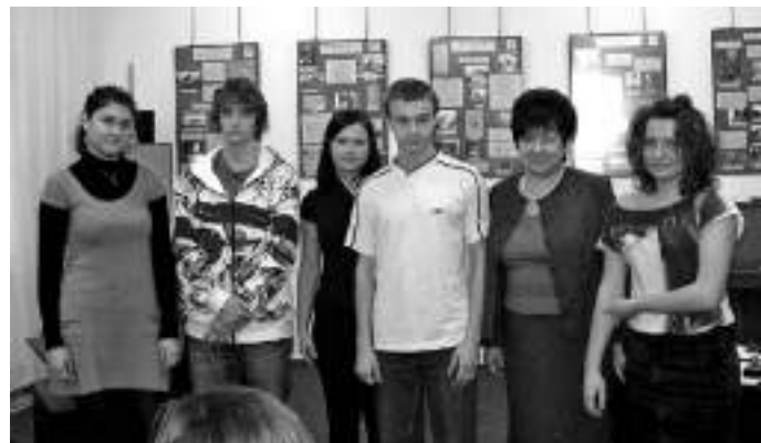
Dyrektor MBP i laureaci konkursu literackiego