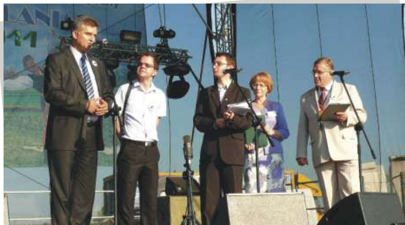
Wystąpienie burmistrza Kawadarci podczas otwarcia „Kasztelanii”