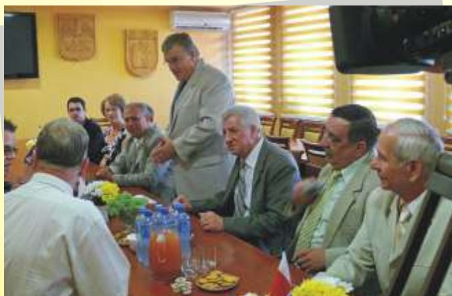
Władze miasta Sierpca

jego pokłosiem była potwierdzona wola ścisłej współpracy. Stosowny, w tej sprawie, dokument zostanie podpisany. Najbardziej prawdopodobne kierunki współdziałania obejmą współpracę szkół i kulturę. Władze Kavadarci zainteresowani są również goszczeniem u siebie naszych przedsiębiorców, co może być dla nich otwarciem perspektywy rozwojowej.