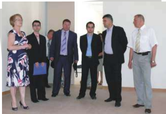
Zwiedzanie inwestycji DK