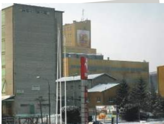
Wyróżnienie - Sylwia Tomaszewska