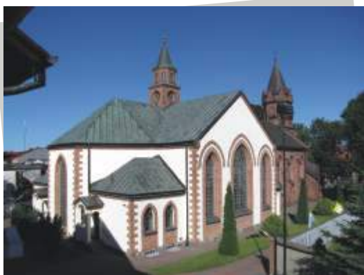
III miejsce - Mateusz Frydrychowicz