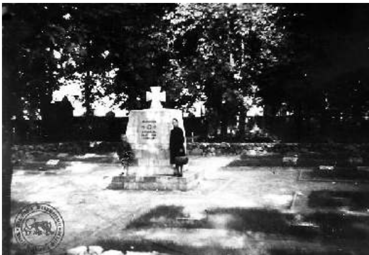
Ilustracja 2: Sierpecki grób - pomnik niemieckich żołnierzy poległych w 1915 roku. Fotografia z 1942 roku.

Dopiero jedna, jedyna fotografia, wykonana podczas II wojny światowej, sugeruje, że poległych mogło być więcej. Pomnik, zwieńczony kamiennym wyobrażeniem niemieckiego krzyża żelaznego, ustawiony został w centralnym punkcie sierpeckiego cmentarza wojennego. Widnieje na nim data 1915, co daje informację, komu został poświęcony. Można też przyjąć, że w tym roku został też wybudowany. Ewentualnie powstał w 1917 r. - wówczas na cmentarzu prawosławnym rozebrana została kaplica, cegły i kamienie z tej budowli miały być wykorzystane w ogrodzeniu kościoła farnego. 5 Równolegle z rozbiórką mogły być prowadzone prace przy budowie okazałej mogiły niemieckich żołnierzy.