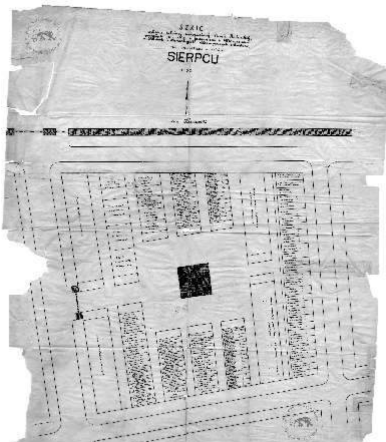
Ilustracja 4: Oryginalny szkic sytuacyjny rozmieszczenia mogił żołnierzy radzieckich na cmentarzu w Sierpcu.

Z dokumentów późniejszych można dowiedzieć się choćby jakie szkoły opiekowały się pomnikiem (a przy okazji i pozostałymi miejscami pamięci na terenie Sierpca) - w 1974 r. patronaż nad mogiłą radziecką sprawowało Liceum Ogólnokształcące, w roku 1989 Szkoła Podstawowa nr 3. 8