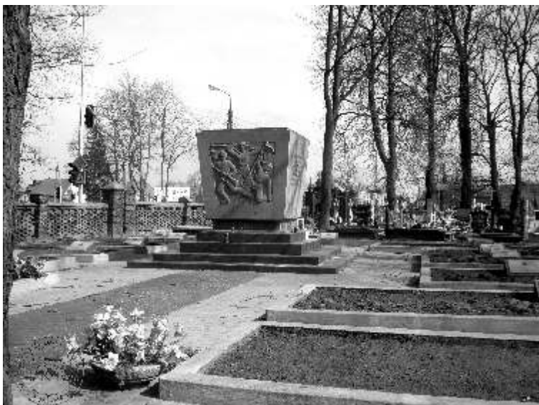
Ilustracja 3: Rok 2011. W miejscu pierwszowojennego niemieckiego cmentarza wojennego znajduje się grób-pomnik radzieckich żołnierzy poległych podczas II wojny światowej

Budowę grobu-pomnika czerwonoarmistów rozpoczęto na początku 1949 roku. Spoczywają tu żołnierze ekshumowani z terenu ówczesnych powiatów: