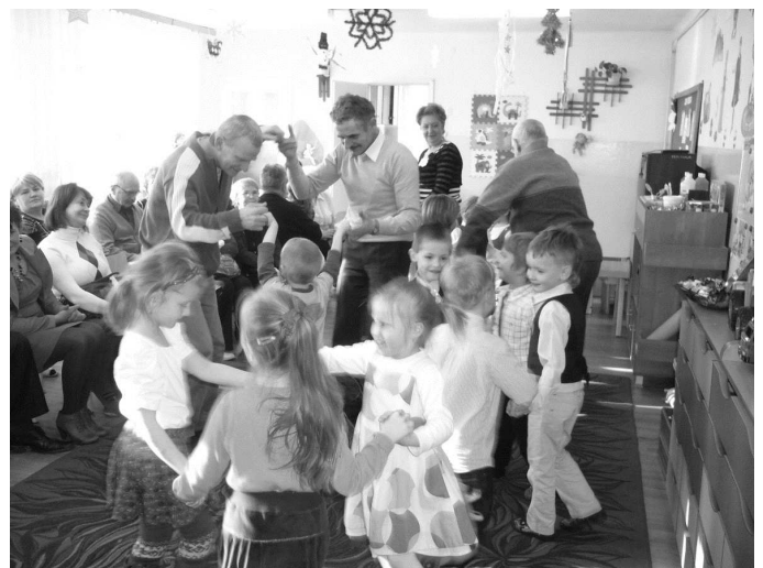
Wspólne tańce Babć i Dziadków z wnukami

Święto Babci i Dziadka to ważne dni w roku. Na tę szczególną okazję dzieci ze wszystkich grup wiekowych przygotowały szereg niespodzianek. Były wiersze i piosenki dedykowane kochanym Babciom i Dziadkom. Nie zabrakło również gorącego „100 lat”. Występy dzieci dostarczyły szanownym gościom wielu wzruszeń. Po części artystycznej przyszedł czas na wręczenie własnoręcznie wykonanych przez dzieci upominków, złożenie życzeń oraz słodki poczęstunek, uroczystość w oddziale dzieci 4-letnich zakończyły wspólne tańce Babć i Dziadków z Wnukami.