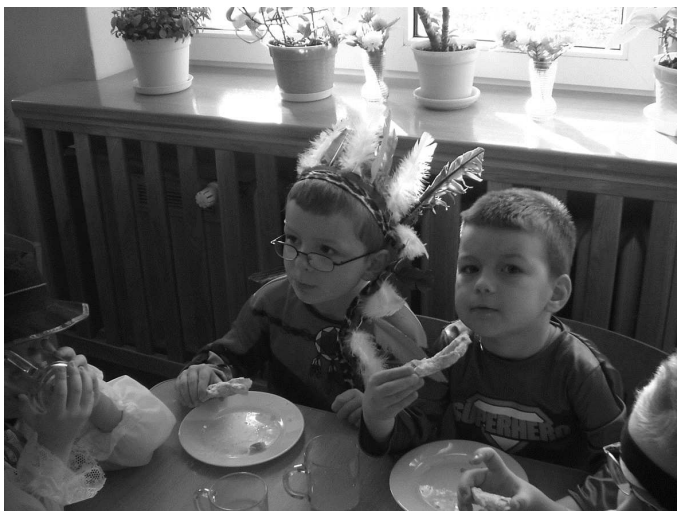
Faworki naszych kucharek smakowały wyśmienicie

Pani Dyrektor wraz z nauczycielkami i rodzicami pełniły rolę wodzirejów i prowadziły wiele zabaw tanecznych oraz korowodów. Dużą porcję muzyki dostarczyła dzieciom rada rodziców, która zorganizowała zespół muzyczno-wokalny pod nazwą: „Rodzic - bend”(w skład zespołu weszli rodzice naszych przedszkolaków). Nasi milusińscy mogli popisać się swoimi umiejętnościami wokalnymi śpiewając znane piosenki razem z naszym zespołem muzycznym. Przedszkolaki ze swymi paniami tańczyły przy największych, dziecięcych przebojach. Dorośli również radośnie skakali w rytm muzyki, a w między czasie robili pamiątkowe fotografie. Wszyscy bawili się wspaniale. Wesołą zabawę przerywały konkursy z nagrodami tj. „taniec z balonem”, „taniec wokół krzesel”, i wiele innych. Małe „co nieco” przygotowane dla wszystkich bawiących się to słodycze, napoje oraz faworki upieczone przez nasze panie kucharki.