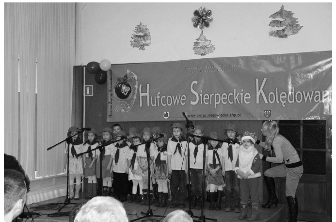
Dyrektor i Rada Pedagogiczna Przedszkola Nr 4

Nasze „zuszki” uczestniczyły też w XXI Hufcowym Kolędowaniu. Zaśpiewały kolędy „Wesołych Świąt” oraz pastorałkę „Drogi Święty Mikołaju”. Z dyplomem i prezentami, w dobrych nastrojach wróciły do przedszkola. Przed zuchami wyjazd do Szkoły Podstawowej w Gójsku na Przegląd Twórczości Artystycznej.