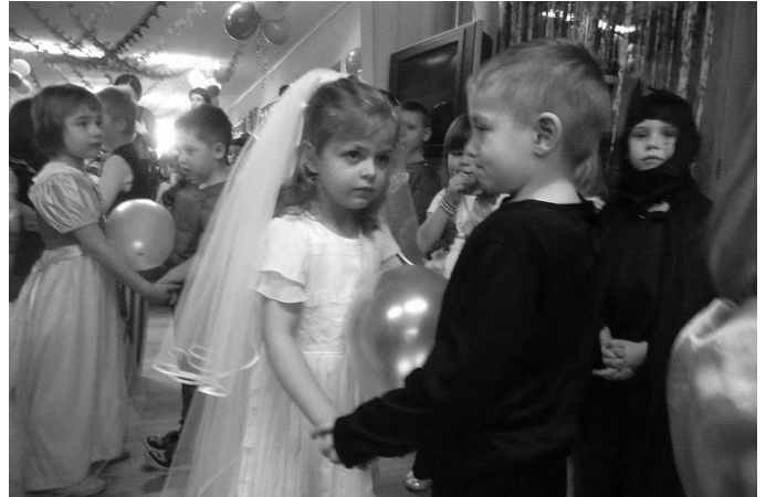
Uczestnicy konkursu „Taniec z balonem”

przyczyniło się do wspaniałego samopoczucia przedszkolaków i niezapomnianych przeżyć.