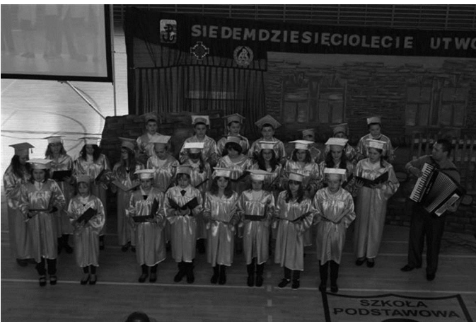
Występ chóru Szkoły Podstawowej w Golezynie

Przedstawienie pt. „Pokolenie AK” oparte było na kanwie wspomnień kombatantów Armii Krajowej. Prezentowało życie ludności polskiej podczas II wojny światowej - zmagania z trudną codziennością czasów okupacji, walk partyzanckie, pierwsze uczucia, piosenki, które podtrzymywały na duchu.