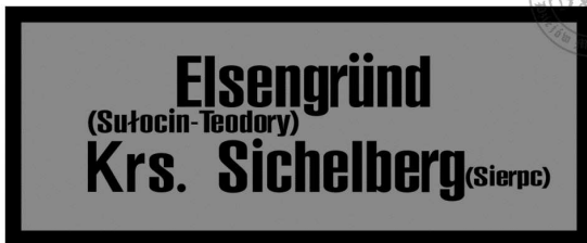
Na samej górze fragment oryginalnej tablicy z lat 1941-1945. Pod fotografią rekonstrukcja graficzna wyglądu tablicy. Poniżej możliwy wygląd całości.