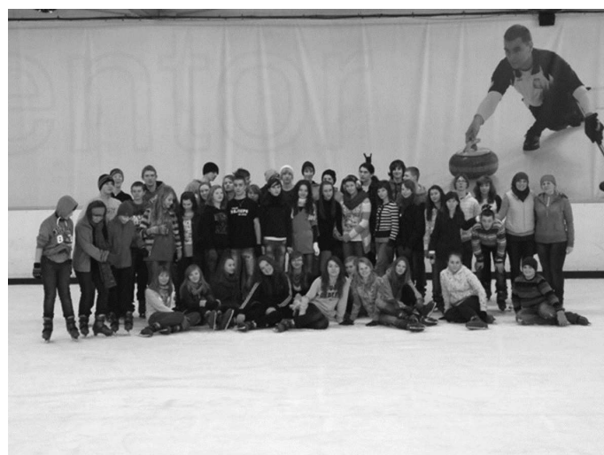
Gimnazjaliści na toruńskim lodowisku

W pierwszym tygodniu zimowej przerwy grupa nauczycieli Gimnazjum Miejskiego im. Mikołaja Kopernika w ramach Dni otwartych stworzyła uczniom możliwość uczestniczenia w rozgrywkach sportowych, „spotkaniach” z językiem angielskim oraz zajęciach koła historycznego. Ponadto 134 gimnazjalistów uczestniczyło w trzech jednodniowych wycieczkach: do Aquaparku w Pluskach oraz dwukrotnie - do Torunia, gdzie dzieci zwiedzały Stare Miasto, obejrzały filmy w Cienema City, skorzystały z oferty sztucznego lodowiska oraz poznawały tajemnice Układu Słonecznego w Planetarium.