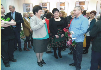
fol. M. Łabędzka