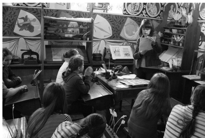
Uczniowie Dwójki w Muzeum Drukarstwa i Piśmiennictwa w Toruniu

Z kolei Szkoła Podstawowa Nr 3 im. ks. Jana Twardowskiego w ramach Dni otwartych zapewniła zainteresowanym udział w Feriach ze sprawdzianem, Feriach na sportowo, Feriach dla sześciolatek oraz Spotkaniach biblijnych. Aż 87 uczniów wzięło udział w wycieczce rekreacyjno – edukacyjnej do Parku Wodnego w Pluskach.