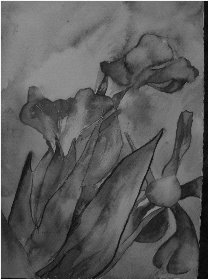
Wystawa prac Ewy Zięby

Zupełnie inne klimaty odnajdujemy w malarstwie Ireneusza Bielińskiego, artysty malarza z Warszawy. Wernisaż wystawy „Być kobietą” miał miejsce 7 marca, w przededniu Dnia Kobiet. Piękno nagości pokazane przez artystę zachwyca subtelną, a pokazane w różnym kontekście i stylizacji staje się intrygujące. Akt to odwieczny motyw sztuk plastycznych, od czasów renesansu studia nagiego ciała są elementem kształcenia artysty. Ireneusz Bieliński absolwent warszawskiego Liceum Sztuk Plastycznych oraz Akademii Sztuk Pięknych w Gdańsku, akty maluje często, ale również portrety, pejzaże i kwiaty. Ostatnio wyspecjalizował się w karykaturach wykonując je na zamówienie firm i osób prywatnych. Z Sierpcem związany jest od lat. Tutaj przyjeżdża na plenery, odwiedza znajomych, maluje im portrety. Jak mówi „Sierpc to miasto artystom przyjazne” więc chętnie tu wraca i równie chętnie prezentuje tutaj swój artystyczny dorobek. Obecną wystawę oglądać można do połowy kwietnia br.