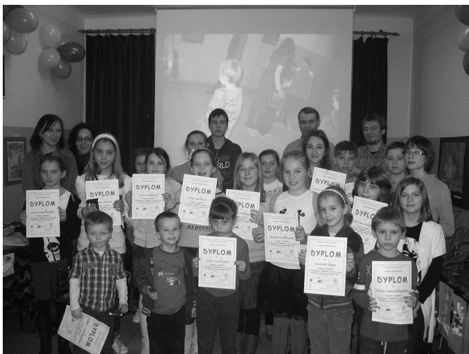
Dom Kultury – podsumowanie projektu „Kredką, pędzłem, uśmiechem, czyli 101 pomysłów na fantastyczną twórczość i uniknięcie nudy”

Dla 30 podopiecznych świetlicy Środowiskowego Ogniska Wychowawczego przy Miejskim Ośrodku Pomocy Społecznej zajęcia zorganizowano w dniach od 16 do 27 stycznia br. W ich ramach dzieci odbyły wycieczki do Muzeum Wsi Mazowieckiej (wystawa 40 lat minęło), Miejskiej Biblioteki Publicznej (udział w zajęciach Szukamy młodych talentów), Domu Kultury (projekcja filmów Uczeń Czarnoksiężnika, Złodziej Pioruna) oraz Szkoły Podstawowej Nr 3 (zajęcia i gry rekreacyjno – sportowe w sali gimnastycznej). W czasie pobytu w świetlicy wychowankowie korzystali z całodziennego wyżywienia.