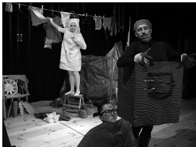
Spektakl dla dzieci „O piecyku i kurzyku”