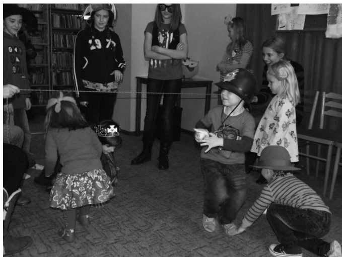
Najmłodszy w MBP

Wychodząc naprzeciw oczekiwaniom Zarządy Osiedli Nr 2, 3, 5 i 6 zorganizowały wycieczki do kina w Płocku, w trakcie których uczestnicy obejrzeli w kinie film pt. Kot w butach, Alvin i Wiewiórki 3, Tsunami 5D, Epoka lodowcowa 5D, Alladyn 5D oraz skosztowali posiłek w McDonald's. Z czterech wyjazdów skorzystało 147 dzieci.