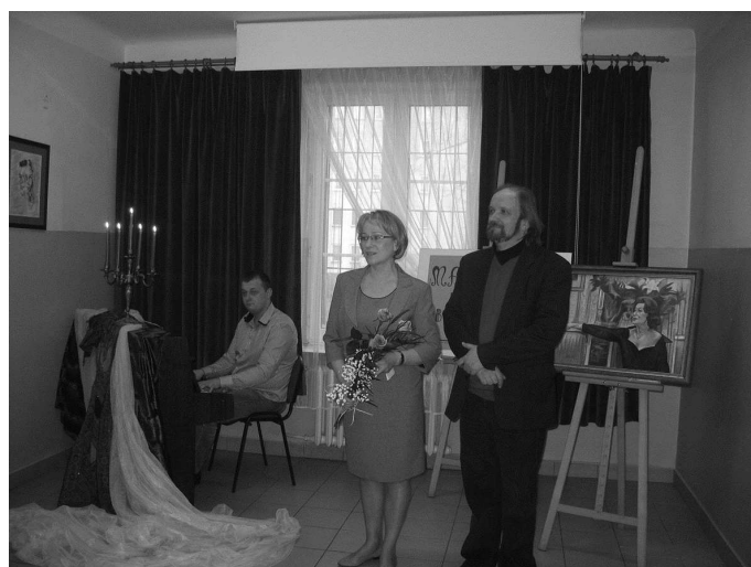
Wystawa malarstwa „Być Kobieta” Ireneusza Bielińskiego

Muzeum we Wrocławiu, a inne prace wzbogacają liczne zbiory prywatne w kraju i za granicą.