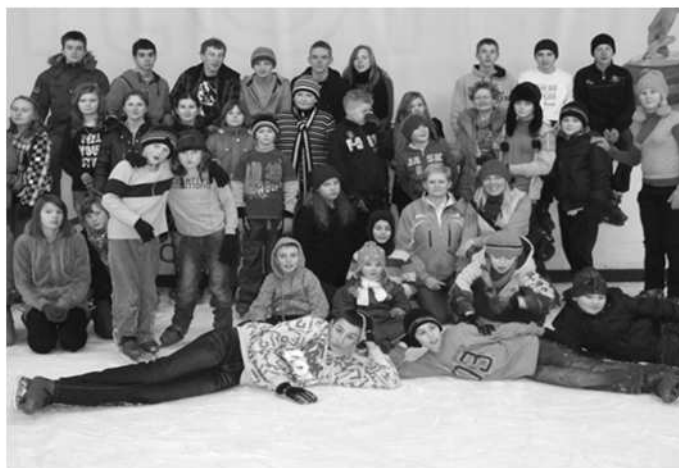
Z dobrodziejstw lodowiska w Toruniu, podczas ferii zimowych skorzystało 47 funkcyjnych Hufca