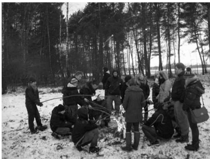
Biwak 8WDSH „Wagabunda” z Mochowa podczas ferii zimowych