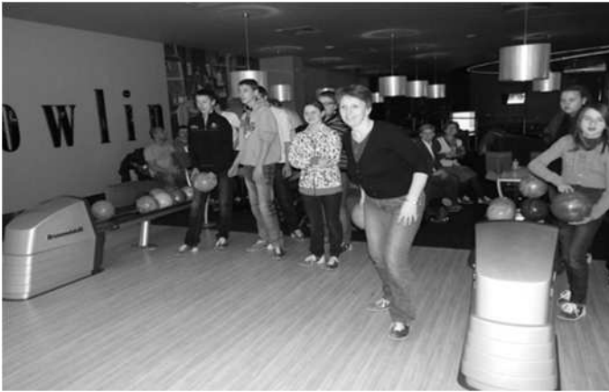
Druchna Lidka ćwiczy oko na kręgielni

Hufca zgodnie z planami Chorągwi brali udział w obowiązkowych szkoleniach.