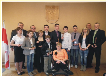
Wyróżnieni Sportowcy 2011 roku.