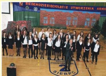
Występ zespołu z Gimnazjum Miejskiego