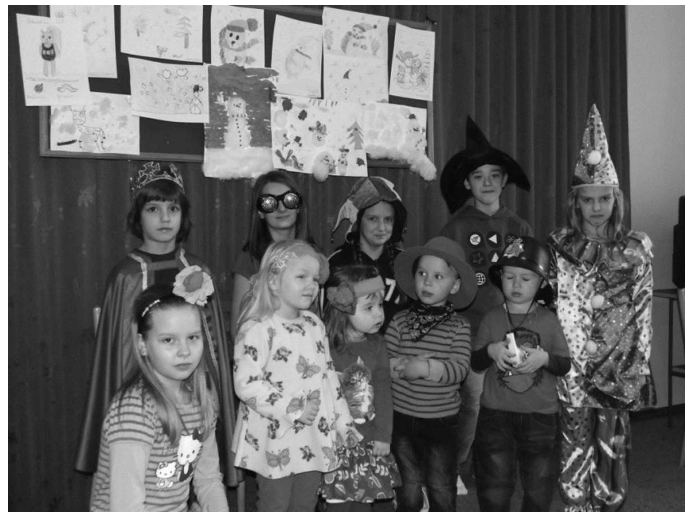
Ferie 2012 w bibliotece

Dzieci chętnie brały również udział w zajęciach plastycznych. W pierwszych dniach ferii powstawały makiety zimowe. Natomiast z okazji dnia dziadka i babci robiliśmy laurki pełne uśmiechu i miłości, zdobiąc je kolorowymi brokatami, cekinami i wstążeczkami. Wykonywaliśmy również maski karnawałowe, które prezentowaliśmy podczas ostatniego dnia ferii na balu, na którym młodsze, jak i starsze dzieci udowodniły, że dobra zabawa nie zna podziałów wiekowych.