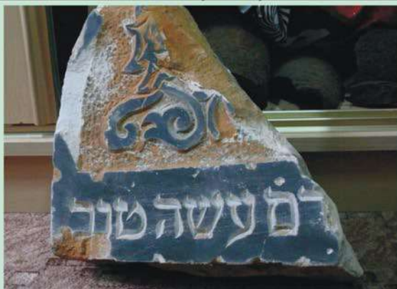
Fragment Macewy odnalezionej na terenie Sierpca

PRACOWNIA DOKUMENTACJI DZIEJÓW MIASTA SIERPCA