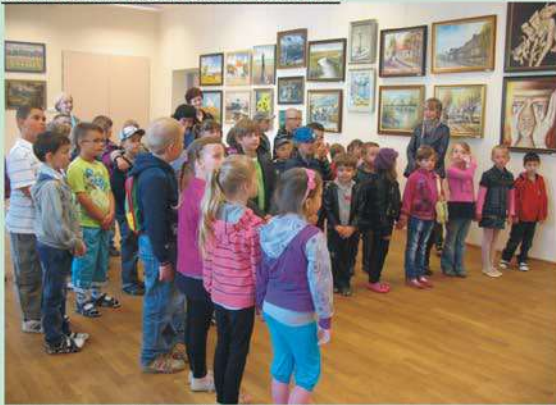
Galeria Sztuki im. Stefana Tamowskiego - wystawa malarstwa sierpeckich twórców - maj 2012r.