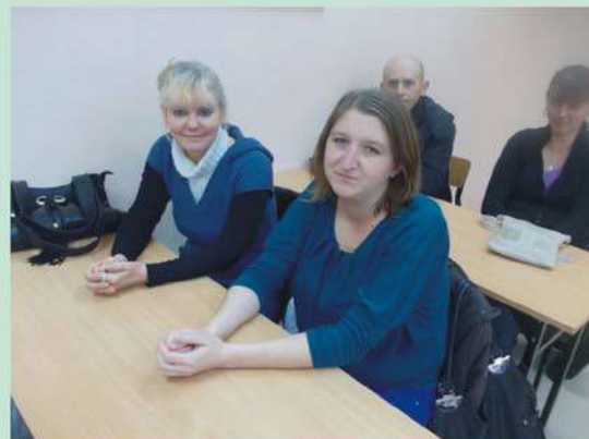
Zajęcia teoretyczne - kurs kucharza

MIEJSKI OŚRODEK POMOCY SPOŁECZNEJ ul. Świętokrzyska 12, 09-200 Sierpc Telefon (24) 275 46 44, e-mail: mops_sierpc@poczta.onet.pl