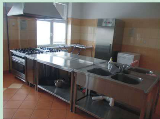
Miejsce pracy kucharzy