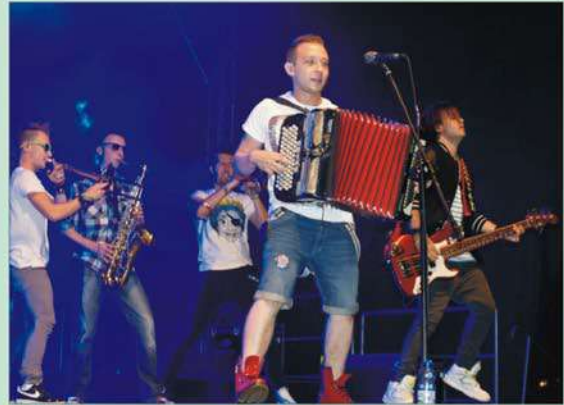
LETNIE GRANIE -koncert zespołu ENEJ 19.08.2012r.