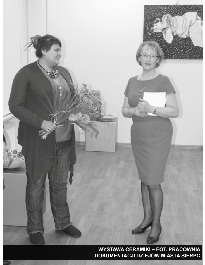
WYSTAWA CERAMIKI