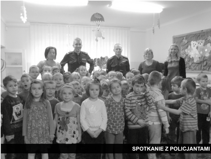
SPOTKANIE Z POLICJANTAMI

przedszkola, które odbyły się z udziałem jednostki straży pożarnej. Wiele emocji i to nie tylko przedszkolakom dostarczył podjeżdżający przed bramę przedszkolną wóz strażacki z włączonym sygnałem. Ćwiczenia ewakuacyjne przebiegły bardzo sprawnie, wszyscy zdali „egzamin” celująco. Po zakończeniu ćwiczeń przedszkolaki oglądały z bliska samochód strażacki.