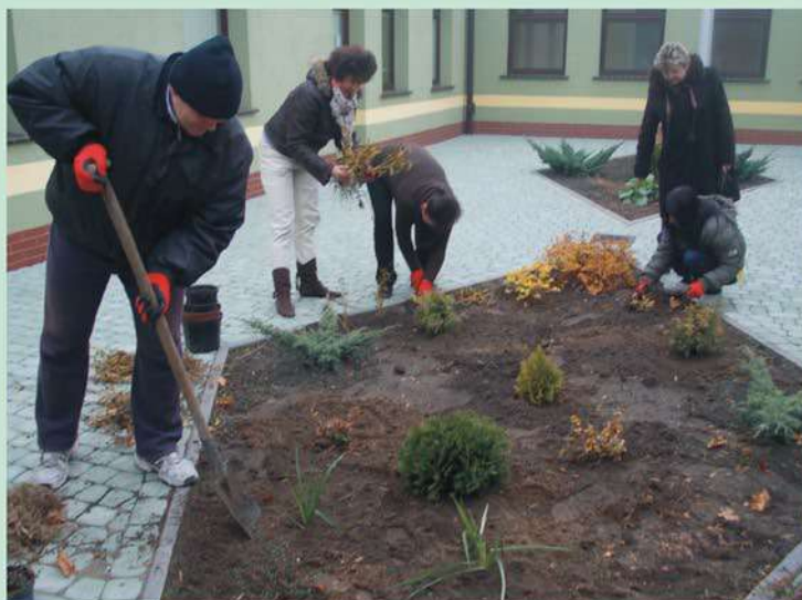
Zajęcia teoretyczne - aranżacja terenów