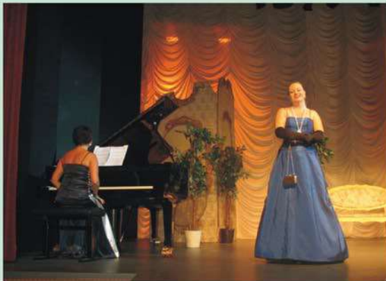
Fragmety operetki - KSIĘŻNICZKA CZARDASZA 01.09.2012r.