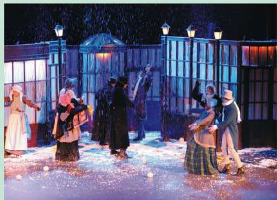
Spektakl OPOWIEŚĆ WIGILIJNA w wykonaniu aktorów Teatru Baj Pomorski z Torunia- 04.12.2012r.