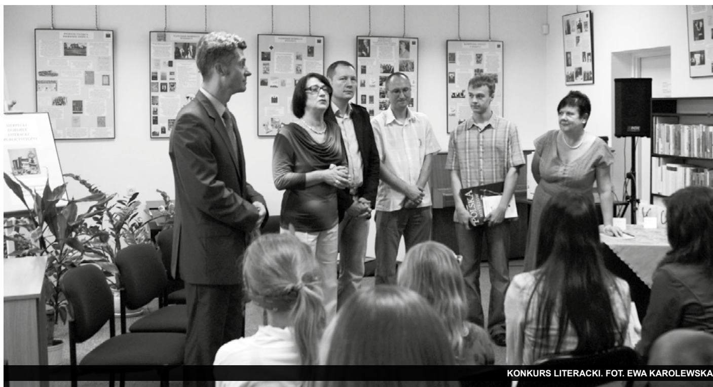
KONKURS LITERACKI. FOT. EWA KAROLEWSKA