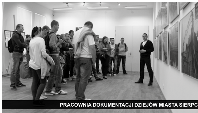
PRACOWNIA DOKUMENTACJI DZIEJÓW MIASTA SIERPC

Ponadto 8 listopada w pomieszczeniach Pracowni odbyło się krótkie spotkanie z grupą uczniów ze Szkoły Podstawowej Nr 2. Ze względu na brak typowego pomieszczenia przeznaczonego na spotkania czy pracownię naukową, ściśnięci uczestnicy spotkania zajęli zarówno miejsca przy stole, jak i na podłodze.