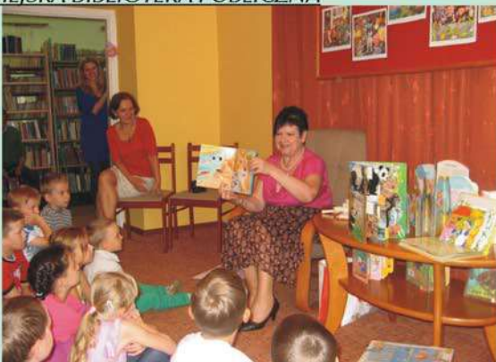
Tydzień czytania dzieciom