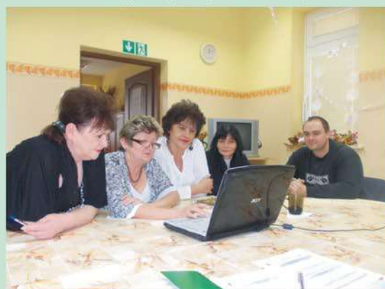
Zajęcia teoretyczne-aranżacja terenów zielonych z opieką nad nagrobkami