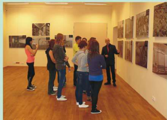
Spotkania w ramach wystawy Auschwitz - Birkenau