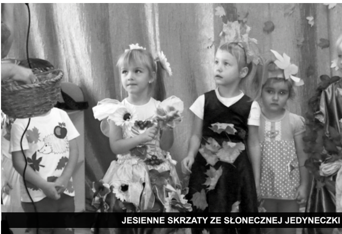
JESIENNE SKRZATY ZE SŁONECZNEJ JEDYNKI