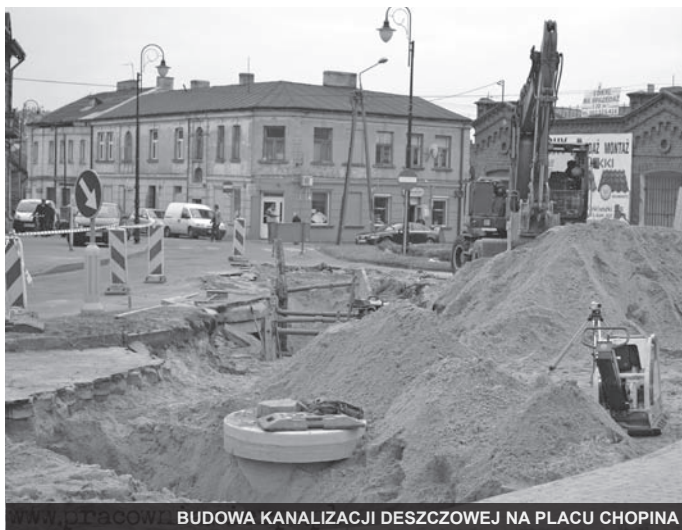
BUDOWA KANALIZACJI DESZCZOWEJ NA PLACU CHOPINA

Trzysta tysięcy złotych kosztowały schody od ulicy Narutowicza na Plac Chopina. Prawie 190 tysięcy złotych przeznaczyliśmy na remont mostu w ulicy Słowackiego. Na budowę ulic i chodników wydaliśmy, w ubiegłym roku, 540 tysięcy złotych. Dotyczyło to, między innymi, takich ulic, jak: Tuwima, Długosza oraz łączników pomiędzy ulicami Pułaskiego i Reymonta oraz Pogodną i Bolesława Śmiałego. Kwotą osiemdziesięciu tysięcy złotych partycypowaliśmy w budowę miejsc parkingowych przy ulicy Narutowicza. Była to inwestycja zrealizowana wspólnie ze Spółdzielnią Mieszkaniową.