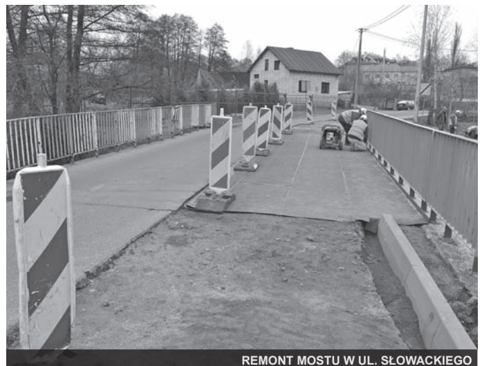
REMONT MOSTU W UL. SŁOWACKIEGO

Chciałbym przypomnieć, że tylko w latach 2010-2013 wybudowaliśmy trzysta i pół kilometra kanalizacji ściekowej. Były to inwestycje bardzo drogie i zdajemy sobie sprawę, że nie-medialne. Uważaliśmy jednak, że musimy je podjąć. Chociażby dlatego, żeby chronić przed dalszą degradacją nasze środowisko.