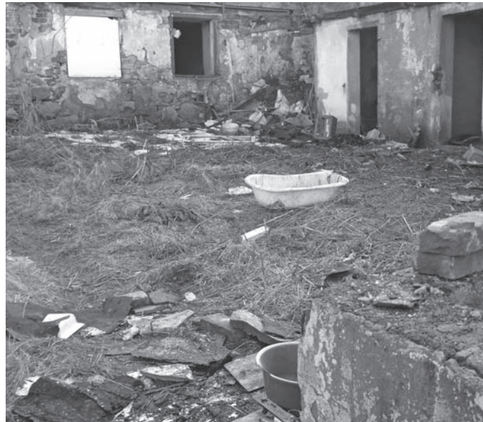
Dziki wysypiska śmieci w mieście – trzeba usunąć.