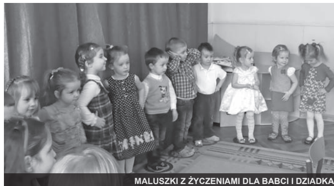
MALUSZKI Z ŻYCZENIAMI DLA BABCI I DZIADKA