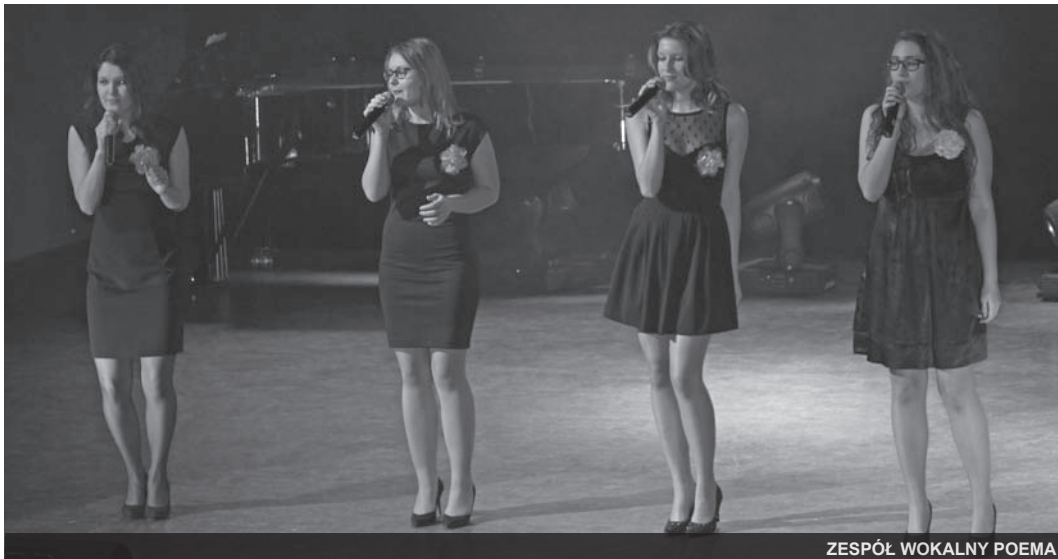
ZESPÓŁ WOKALNY POEMA

Koncert zakończyła „ Poema ” wiązką Rock and roll i piosenką „ Wszystkiego najlepszego ”, którą nuciła wraz z zespołem cała, wypełniona po brzegi sala.