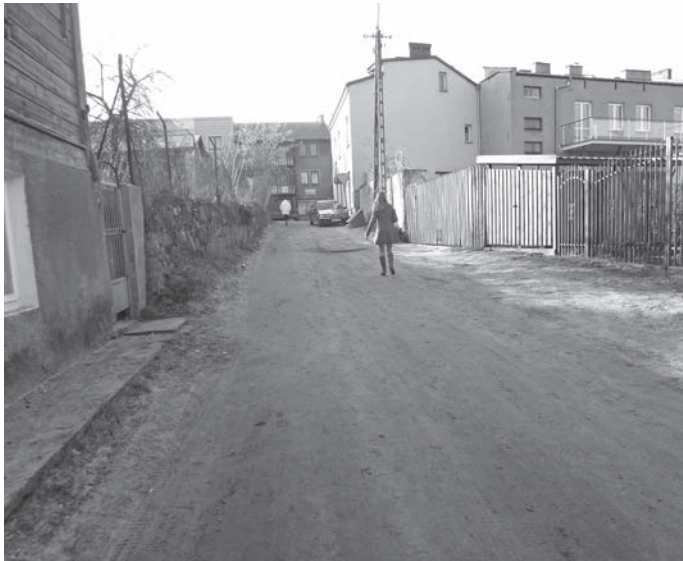
Ulica Marii Konopnickiej. Jedna z tych zapomnianych.