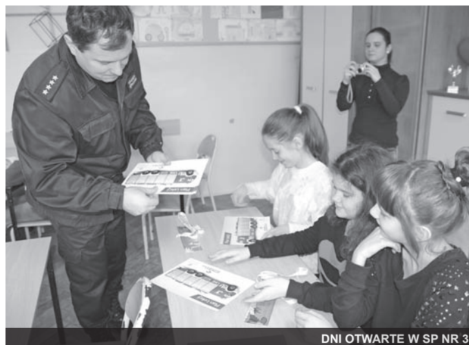
DNI OTWARTE W SP NR 3