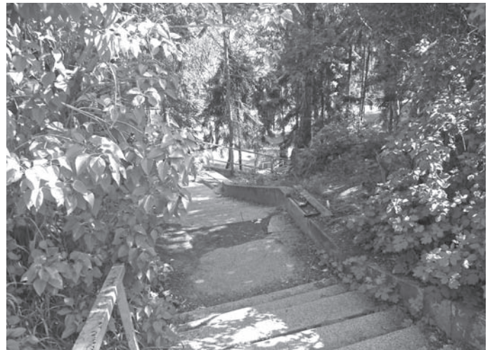
SCHODY OD UL. NARUTOWICZA NA PLAC CHOPINA PRZED REMONTEM...

W ubiegłym roku staraliśmy się podejmować decyzje odważne, ale jednocześnie rozsądne. Kontynuowaliśmy strategię zrównoważonego rozwoju miasta. Działaliśmy ze świadomością