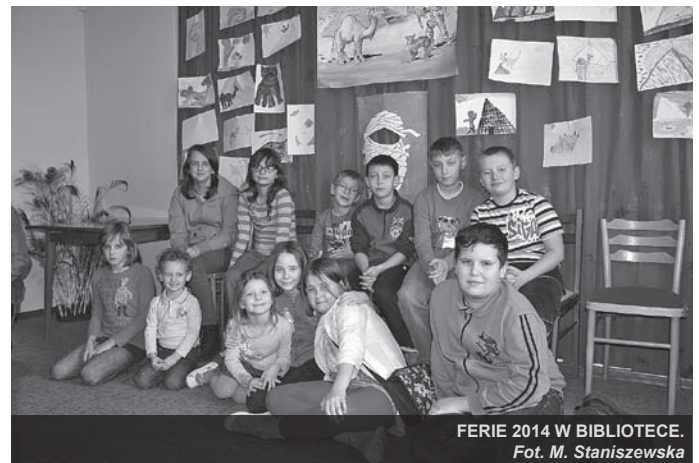
FERIE 2014 W BIBLIOTECE.