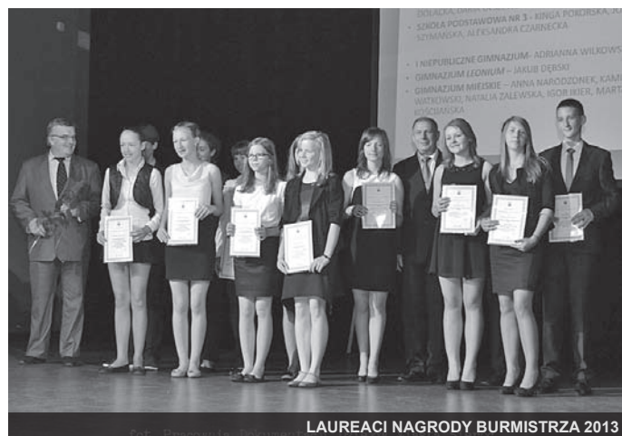
LAUREACI NAGRODY BURMISTRZA 2013

Skalę i zakres możliwości naszego działania determinowały, jak zawsze, posiadane środki budżetowe. Po stronie wydatków była to kwota ponad 47 milionów złotych. Największy udział, w wydatkach budżetowych, miała oświata. Na funkcjonowanie