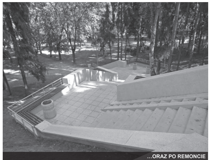
...ORAZ PO REMONCIE

konieczności nadrobienia zapóźnienia cywilizacyjnego i jednocześnie podążania za społecznymi oczekiwaniami.