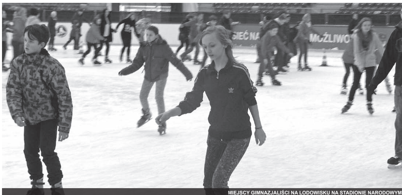
MIEJSCY GIMNAZJALIŚCI NA LODOWISKU NA STADIONIE NARODOWYM