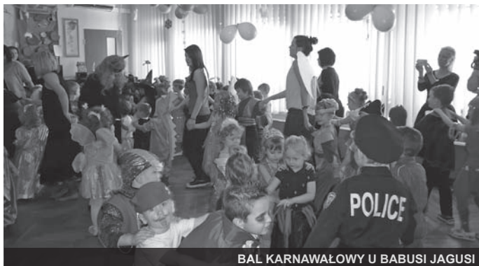
BAL KARNAWAŁOWY U BABUSI JAGUSI