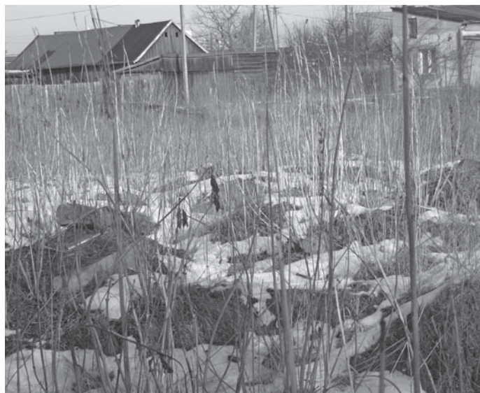
W tym miejscu miał powstać nowoczesny market TESCO – teren składu opałowego przy ul. Traugutta – dzisiejszy wygląd przeraża – oćcie Państwo sami.