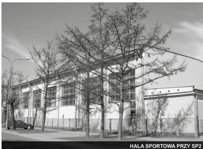
HALA SPORTOWA PRZY SP2

Do najbardziej znaczących efektów działań inwestycyjnych z pierwszego obszaru należą: oddana w 1998 roku kryta pływalnia. W tym samym czasie, przy ówczesnej Szkole Podstawowej nr 1 przekazano szesnastoizbowy pawilon dydaktyczny, z nowoczesnym wyposażeniem. W następnym roku rozpoczęliśmy generalny remont historycznego budynku głównego tej szkoły. Obecnie mieści się w nim Gimnazjum Miejskie. W 2002 roku, przy Szkole Podstawowej nr 2 została przekazana pełnowymiarowa hala sportowa wraz zapleczem. W latach późniejszych podjęty został remont historycznego budynku tej szkoły. W 2004 roku został przeprowadzony generalny remont, z termomodernizacją, budynku Szkoły Podstawowej nr 3. W latach 2007-2009 przy szkole powstał kompleks wielofunkcyjnych boisk ze sztuczną trawą i sportową infrastrukturą. W tych samych latach, zabiegom modernizacyjnym poddane zostały budynki naszych przedszkoli. To najważniejsze inwestycje oświatowe. Pochłonęły wielomilionowe nakłady. Należy podkreślić, że inwestycje oświatowe nie były celem ale środkiem realizacji, wpisanego w strategię, przesłania, którym było inwestowanie w intelektualny rozwój dzieci. Dlatego też subwencję oświatową wspieraliśmy znaczącymi środkami budżetowymi, gdyż sama subwencja skazywałaby