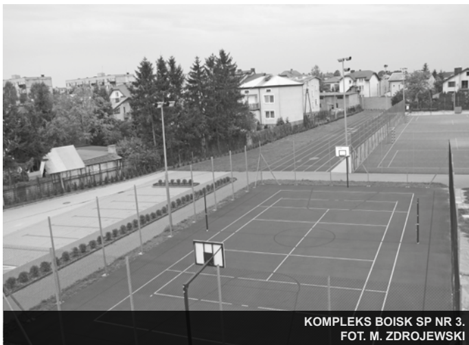
KOMPLEKS BOISK SP NR 3.

było słuszne, i co najważniejsze, bardzo racjonalne. Pozwalało wyprzedzająco wdrażać procedury planistyczne, dokumentacyjne i zabezpieczać finansowanie, co zapewniało płynność inwestycyjną. Słowa uznania należą się radom poprzednich kadencji, że były wierne przyjętej strategii rozwojowej i nie uległy pokusie medialnie nośnych inwestycji, pod potrzeby kolejnych kampanii wyborczej.