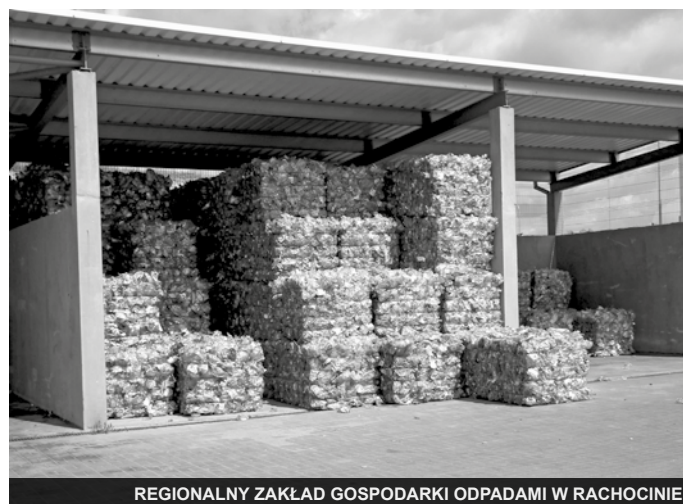
REGIONALNY ZAKŁAD GOSPODARKI ODPADAMI W RACHOCINIE

tylko peryferyjne osiedla ale i wiele miejsc w centralnej części miasta. W ciągu minionych dwudziestu czterech lat przybyło ponad trzydzieści pięć kilometrów sieci kanalizacyjnej z przyłączami oraz kilka przepompowni. Dzięki temu ten wstydliwy problem, dla większości mieszkańców, stał się byłym. Zaawansowane prace trwają na terenie ostatniej enklawy – na osiedlu zatorami.