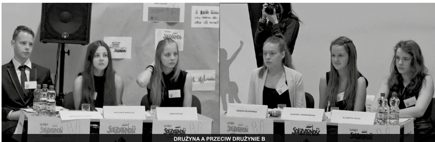
DRUŻYNA A PRZECIW DRUŻYNIE B

ostrożnego racjonalisty, nieskłonny do burzenia zastanego porządku. Nasza młodzież poprzez proces wychowawczy została utwierdzona w przekonaniu, że system, w jakim żyje, jest dobry i więcej się zyska poprzez dostosowanie się do niego niż przez okazywanie woli burzenia.