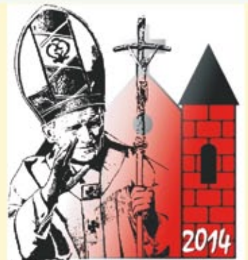
Rokiem Jana Pawła II w Sierpcu