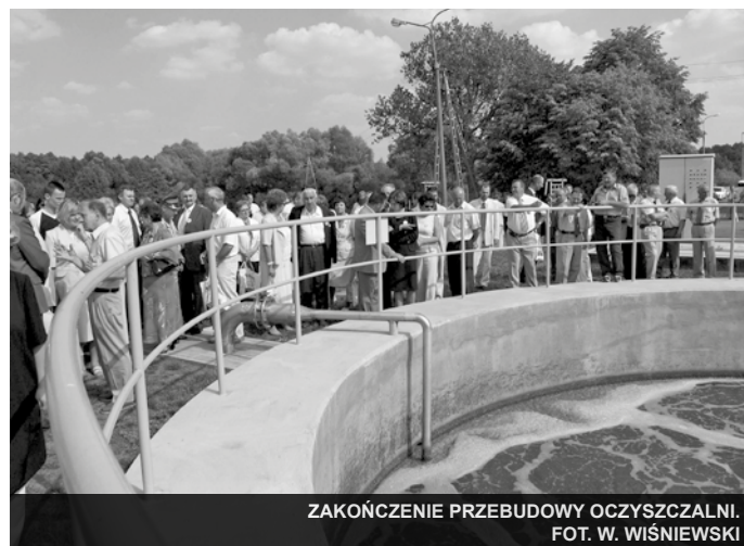
ZAKOŃCZENIE PRZEBUDOWY OCZYSZCZALNI.