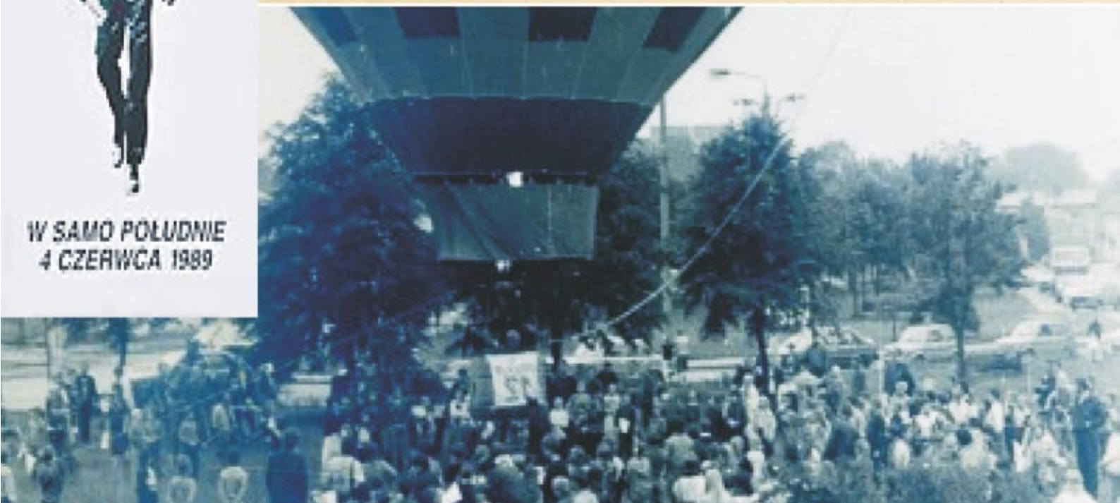
Plac Chopina w Sierpcu w dniu wyborów do Sejmu kontraktowego i reaktywowanego Senatu.