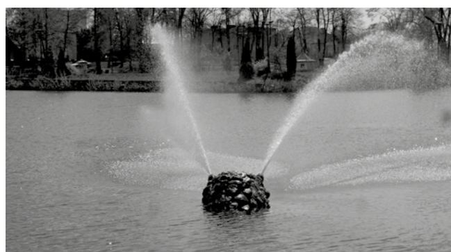
WODNY „ŻÓŁWIK” NA AKWENIE W PARKU „JEZIÓRKA”