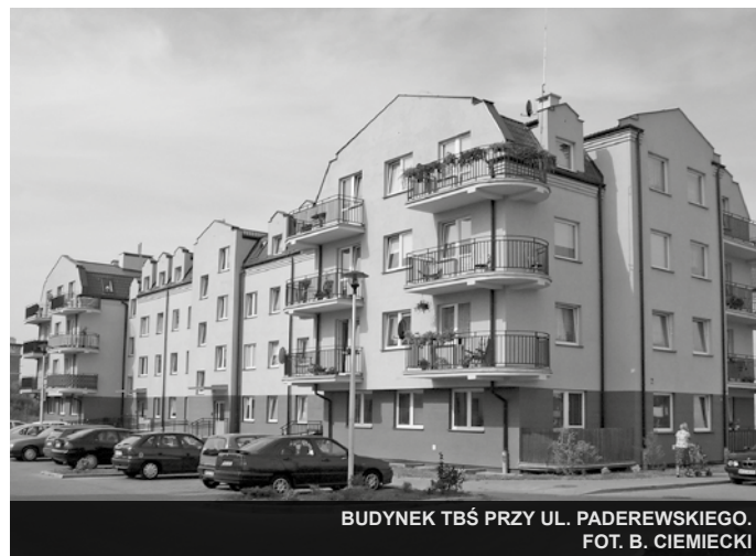
BUDYNEK TBŚ PRZY UL. PADEREWSKIEGO.

Na progu lat dziewięćdziesiątych Sierpc dysponował oczyszczalnią ścieków i zaledwie dwiętnastoma kilometrami sieci kanalizacyjnej. Poza jej zasięgiem znalazły się nie