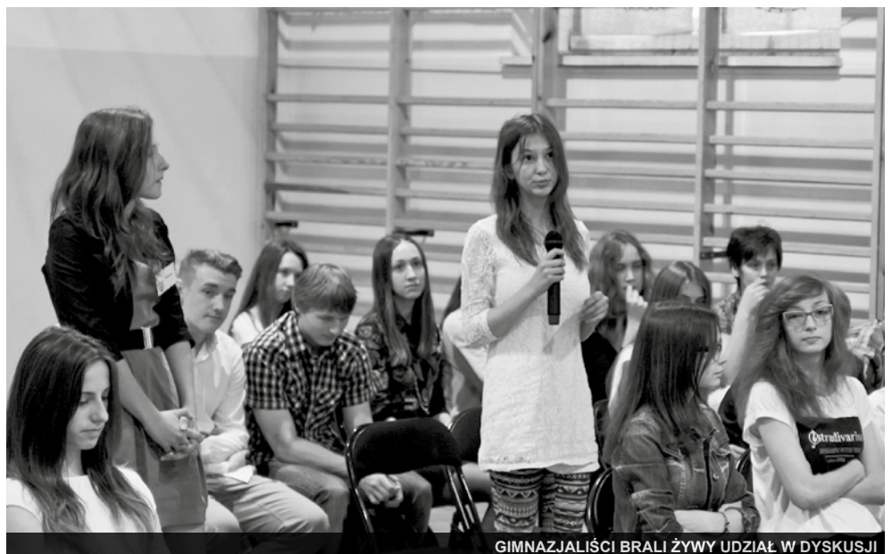
GIMNAZJALIŚCI BRALI ŻYWY UDZIAŁ W DYSKUSJI

Debata w GM okazała się nieoczekiwanie eksperymentem socjologicznym, który wprost domaga się interpretacji. Wypowiedzi uczniów, ale przede wszystkim głosowania ujawniły, na jakiej światopoglądowej płaszczyźnie sytuuje się nasza sierpecka młodzież. Okazuje się, że najbliższa jej jest postawa