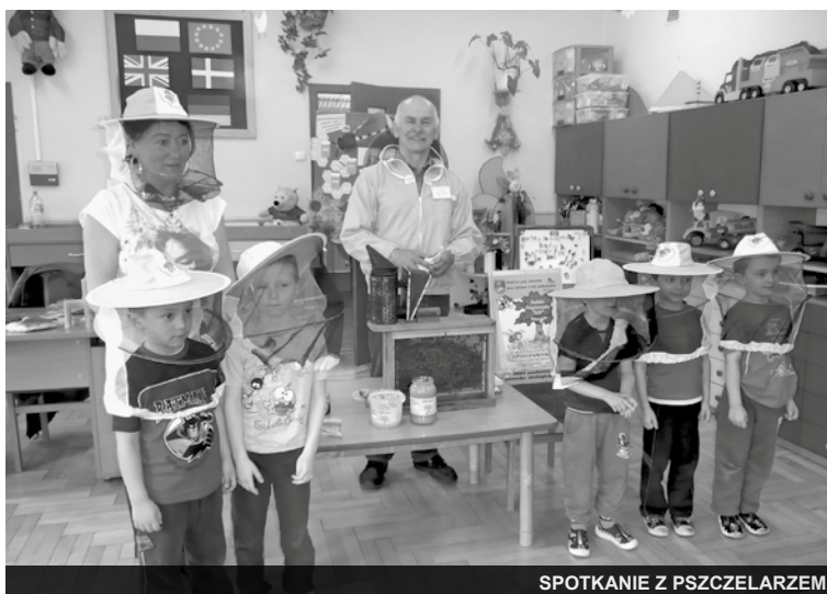
SPOTKANIE Z PSZCZELARZEM