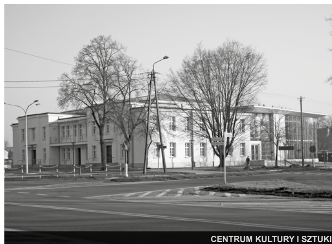
CENTRUM KULTURY I SZTUKI