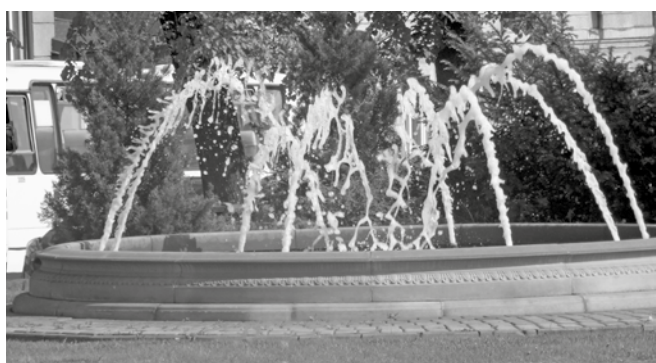
SKWER NA SKRZYŻOWANIU ULIC PIASTOWSKA – PŁOCKA PRZY POCZCIE