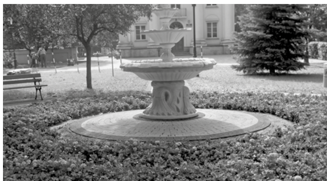
FONTANNA W PEŁNEJ KRASIE