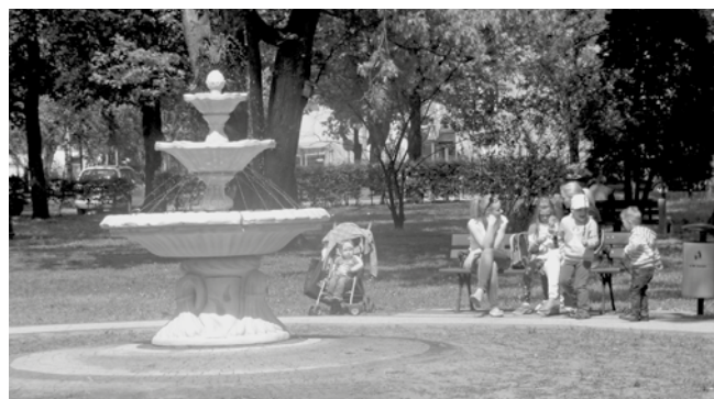
PARK ZNOWU TĘTNI ŻYCIEM (RODZICE Z DZIEĆMI BAWIĄ SIĘ)