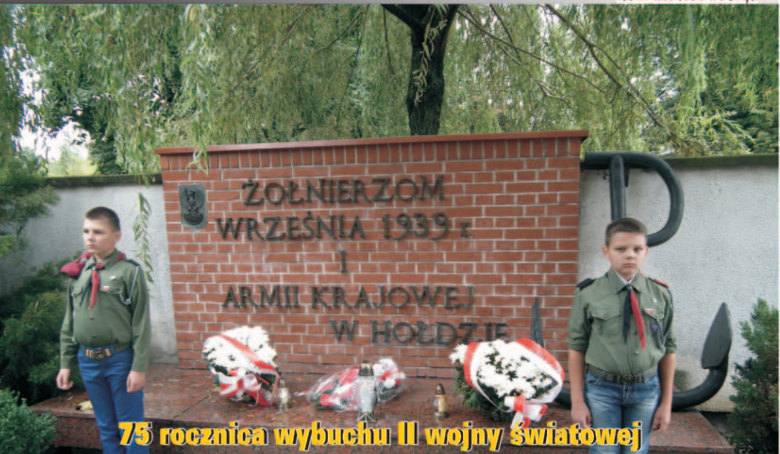
75 rocznica wybuchu II wojny światowej