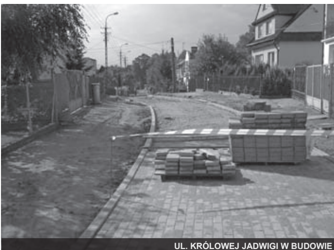
UL. KRÓLOWEJ JADWIGI W BUDOWIE