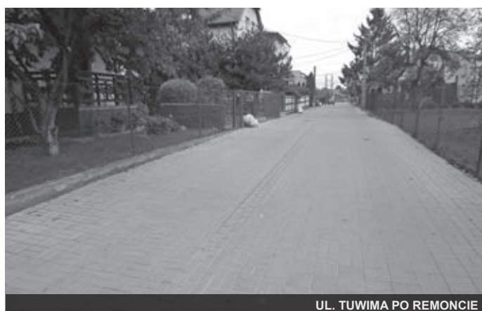
UL. TUWIMA PO REMONCIE

Wydatki na najważniejsze inwestycje w 2013 roku wyniosły – 5 658 700 zł , w tym: