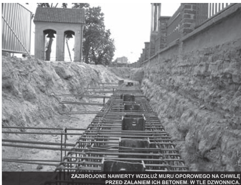
ZABROJONE NAWIERTY WZDŁUŻ MURU OPOROWEGO NA CHWILĘ PRZED ZALANIEM ICH BETONEM. W TLE DZWONNICA.