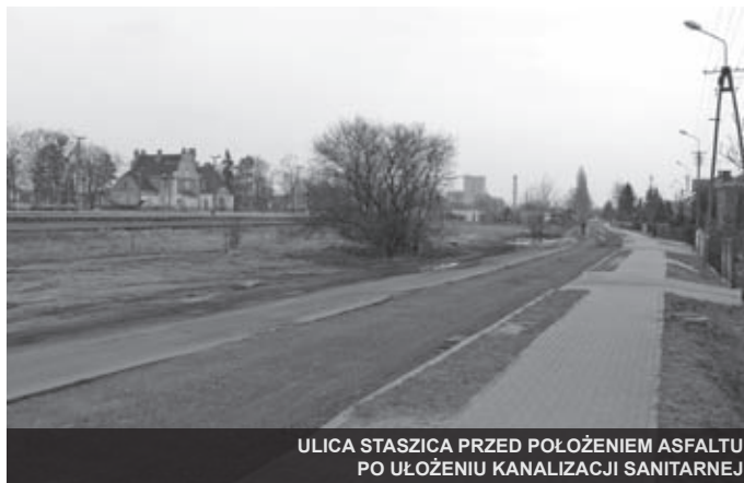
ULICA STASZICA PRZED POŁOŻENIEM ASFALTU PO UŁOŻENIU KANALIZACJI SANITARNEJ