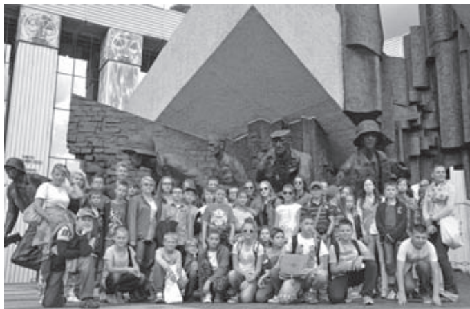
UCZNIOWIE SP NR 2, SP NR 3 I GM W WĘDRÓWCE ŚLADAMI POWSTANIA WARSZAWSKIEGO (28 VIII 2014)