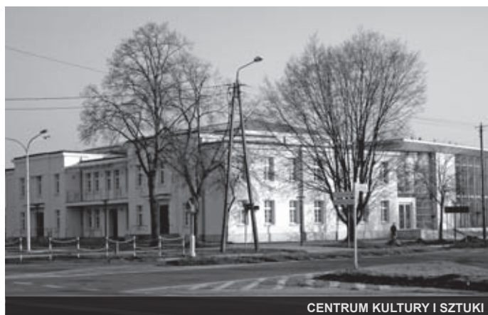
CENTRUM KULTURY I SZTUKI

Inwestycja Centrum Kultury i sztuki w Sierpcu realizowana w latach 2010-2012 w kwocie wydatków opiewających na 18 858 000 zł z czego dofinansowania z Unii Europejskiej wyniosło 9 873 400 zł.