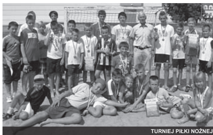
TURNIEJ PIŁKI NOŻNEJ

Informacje szczegółowe dostępne na stronie: