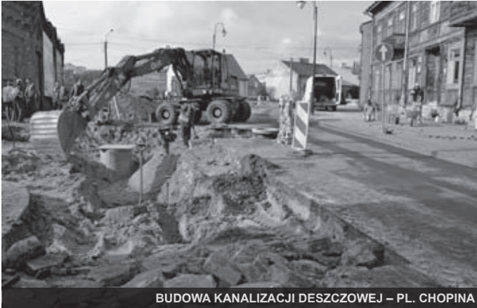
BUDOWA KANALIZACJI DESZCZOWEJ – PL. CHOPINA