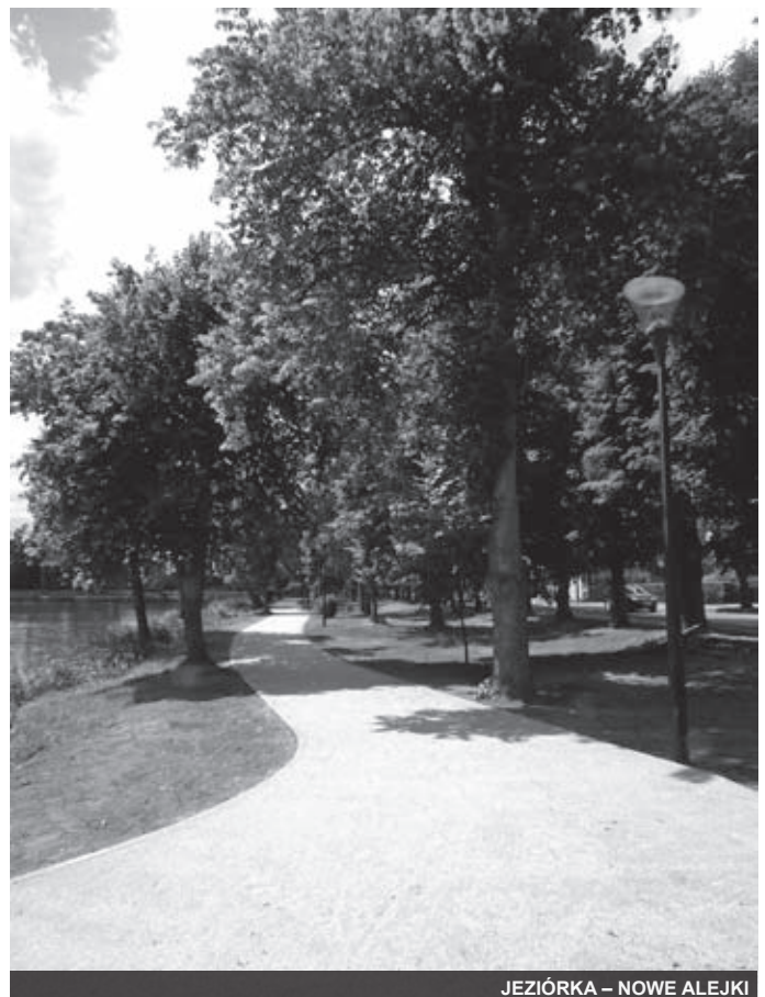
JEZIORKA – NOWE ALEJKI