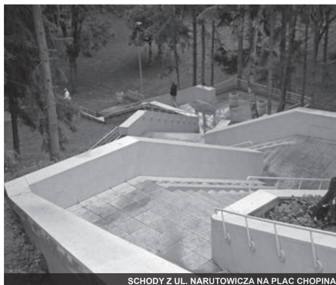
SCHODY Z UL. NARUTOWICZA NA PLAC CHOPINA