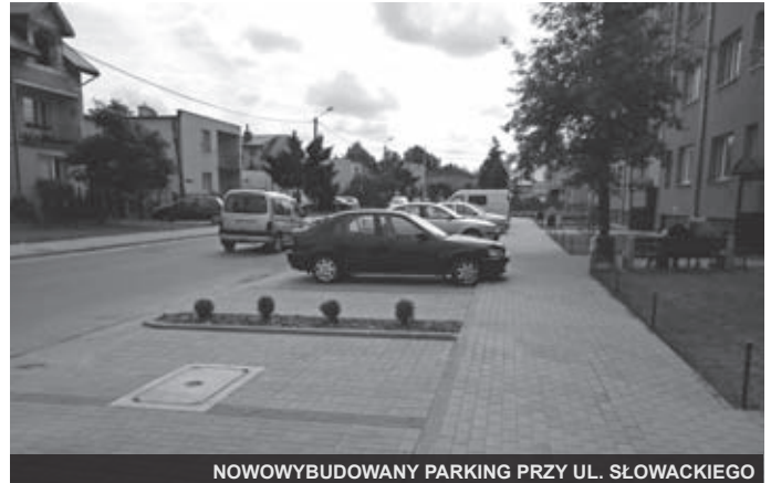
NOWOWYBUDOWANY PARKING PRZY UL. SŁOWACKIEGO