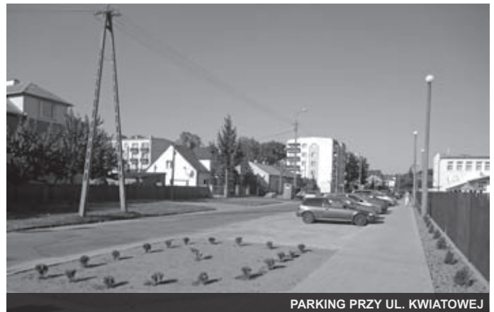
PARKING PRZY UL. KWIATOWEJ