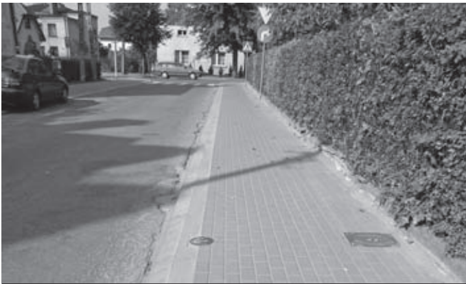
REMONT UL. TYSIĄCLECIA WRAZ Z CHODNIKIEM