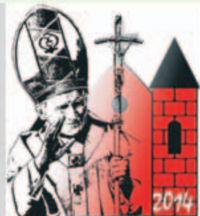
Rokiem Jana Pawła II w Sierpcu