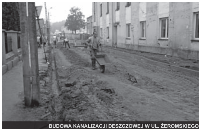
BUDOWA KANALIZACJI DESZCZOWEJ W UL. ŻEROMSKIEGO