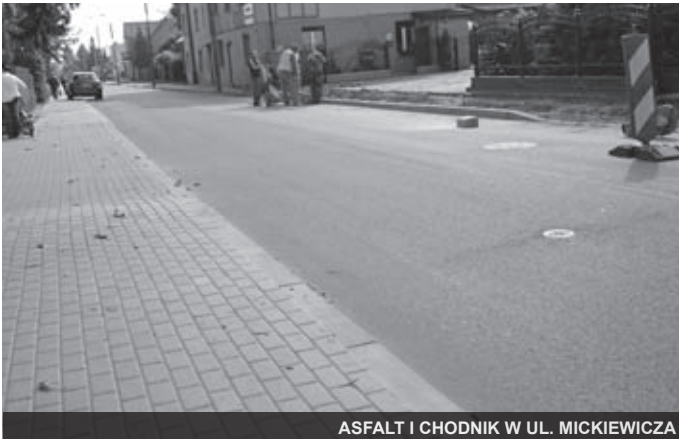
ASFALT I CHODNIK W UL. MICKIEWICZA