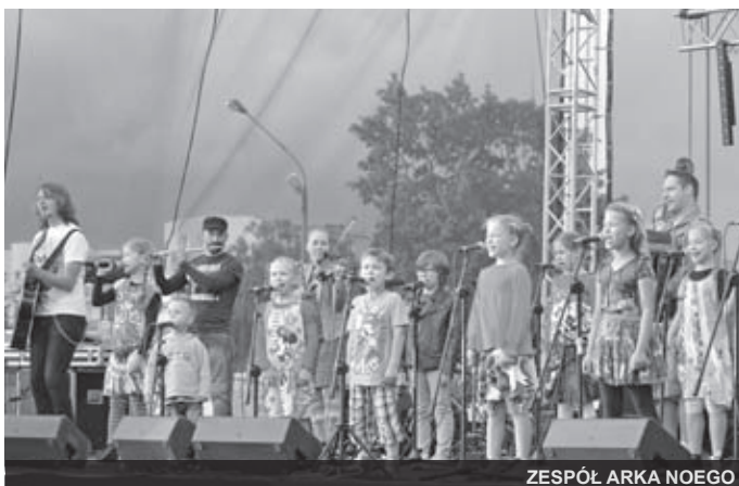
ZESPÓŁ ARKA NOEGO